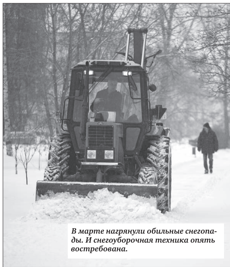
В марте нагрянули обильные снегопады. И снегоуборочная техника опять востребована.

Ехал в Нижнюю Салду. Выезжая из-за поворота в сторону Мохового, вижу, как несётся снегоуборочный КамАЗ по середине дороги. Пришлось резко сбавить скорость, из-за чего машина, ехавшая сзади, тормозила по заснеженной обочине. Ответьте, пожалуйста, какие правила у этих «чистильщиков»?