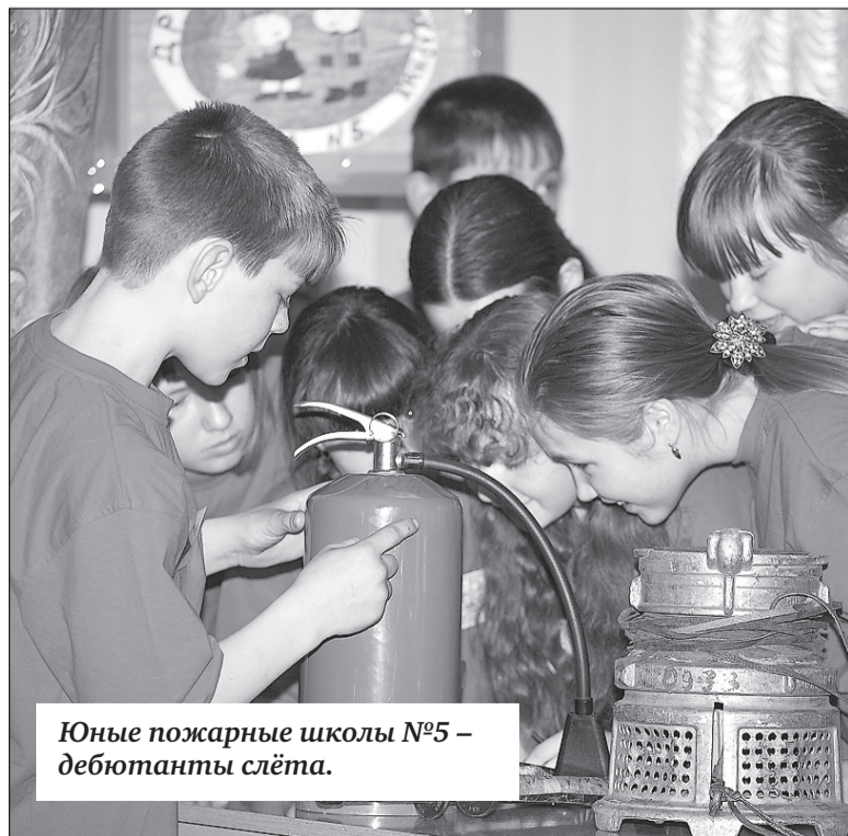
Юные пожарные школы №5 – дебютанты слёта.

5 марта в актовом зале школы №7 состоялся слёт дружин юных пожарных. За звание лучшей в городе ДЮП боролись команды трёх школ.