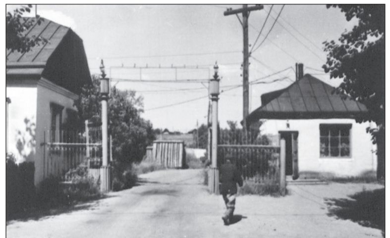
Проходная металлзавода, 1978 г.

Если в вашем семейном альбоме есть интересные фото молодой застройки Салды или редкие фотографии со старинными зданиями, которых уже нет, приносите их в редакцию. Построим город заново из фото-кирпичиков!