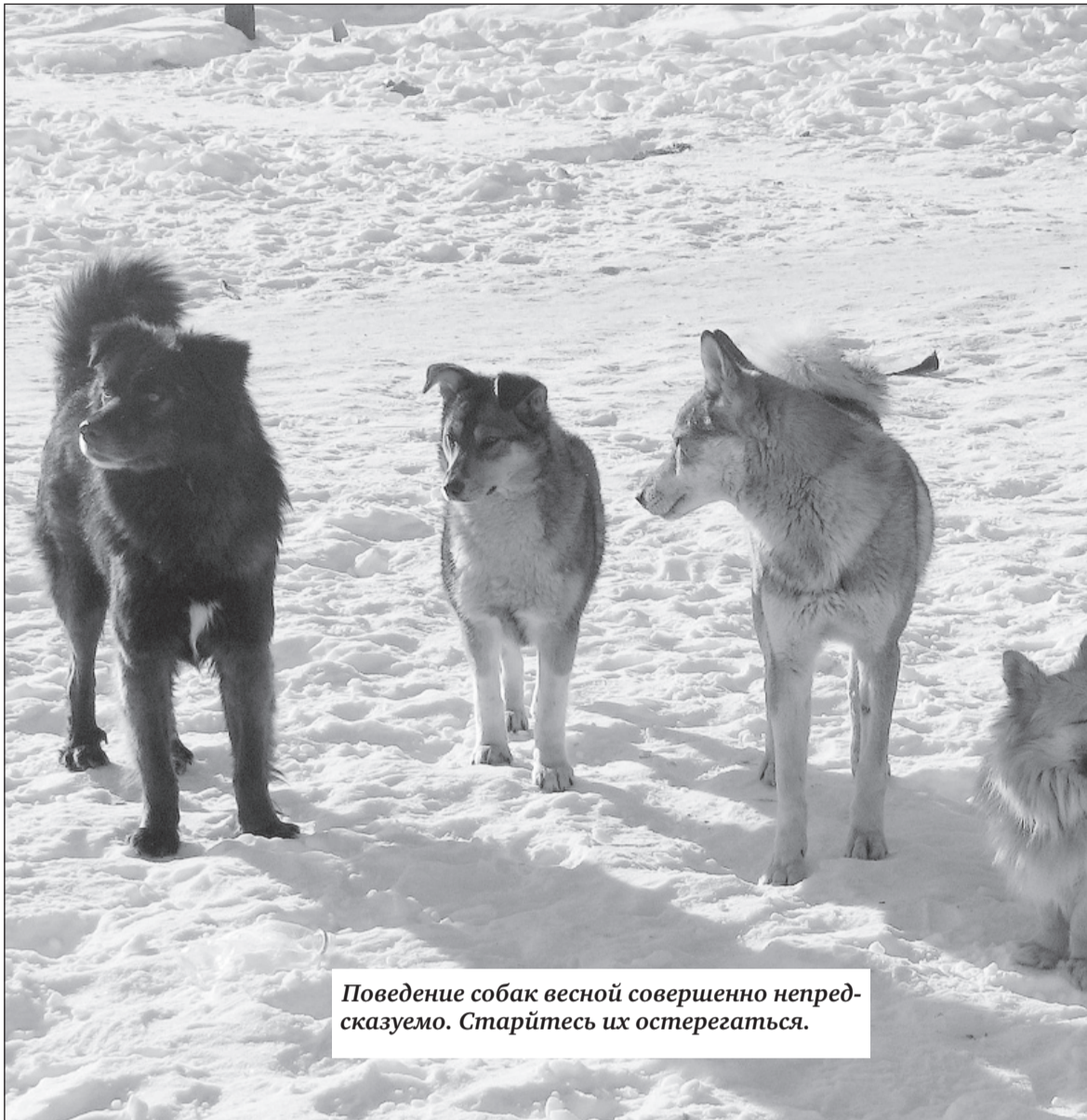
Поведение собак весной совершенно непредсказуемо. Старайтесь их остерегаться.