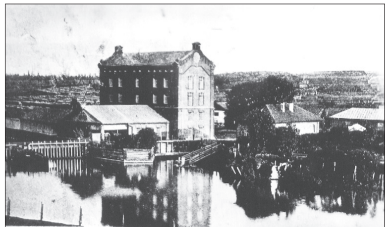
Мельница Треухова на р. Салда, 1903г.

Если в вашем семейном альбоме есть интересные фото молодой застройки Салды или редкие фотографии со старинными зданиями, которых уже нет, приносите их в редакцию. Построим город заново из фото-кирпичиков!