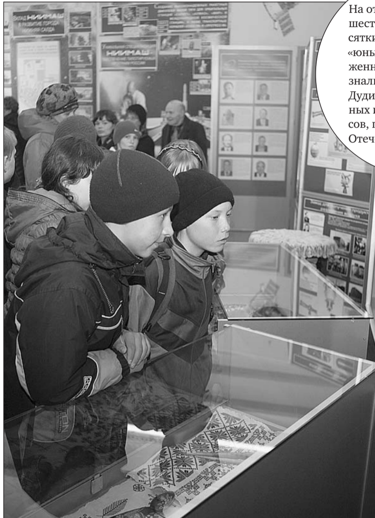
Пристальное внимание дети обращали именно на предметы старины.

– Мне помогают наши краеведы. После долгой паузы в работе