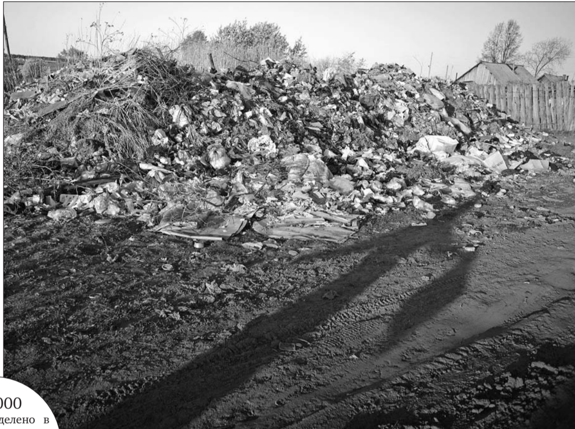
Помойку организовали жители этого района.

Несанкционированные свалки из года в год появляются в одних и тех же районах города. С проблемными местами боролись уже неоднократно в конце улицы 8 Марта, по дороге в Совхоз, по ул. Луначарского – под мостом. В