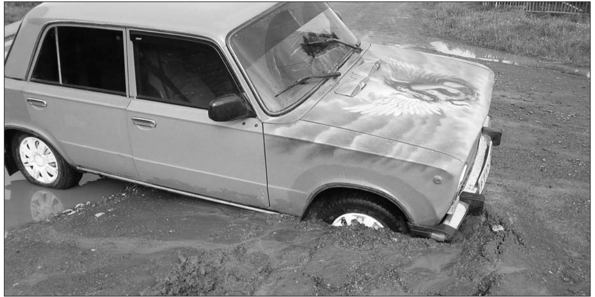
К ямам на дорогах прибавились подземные ловушки.