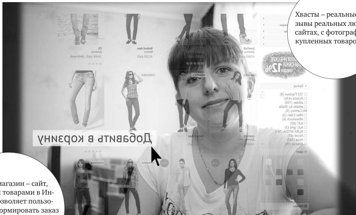
Салдинцы уже давно позволяют себе брендовые вещи и покупают то, чего у нас в городе никогда не найти.

Интернет-магазин – сайт, торгующий товарами в Интернете. Позволяет пользователям сформировать заказ на покупку, выбрать способ оплаты и доставки заказа.