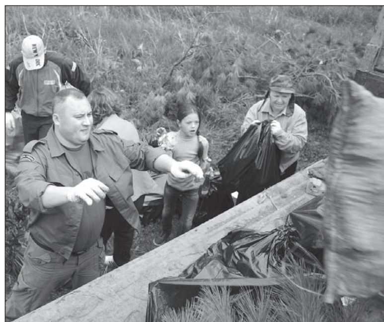
Мусора набралась целая машина.