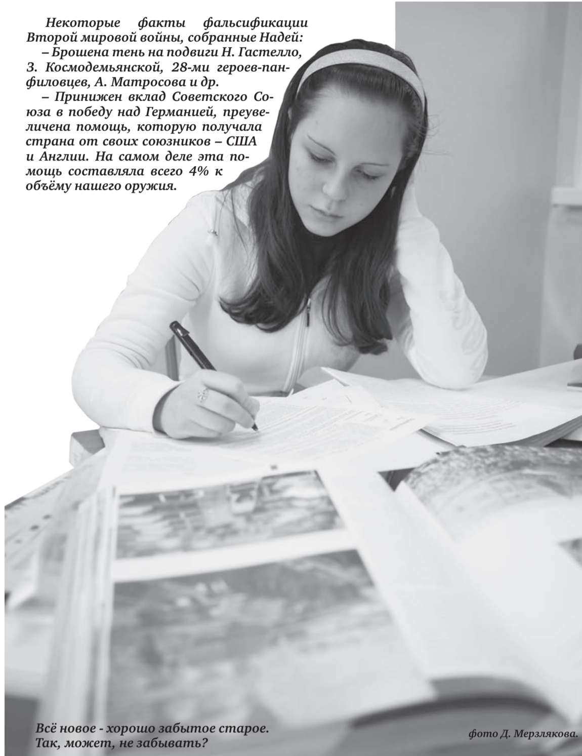
Всё новое - хорошо забытое старое. Так, может, не забывать?

– Принижен вклад Советского Союза в победу над Германией, преувеличена помощь, которую получала страна от своих союзников – США и Англии. На самом деле эта помощь составляла всего 4% к объёму нашего оружия.