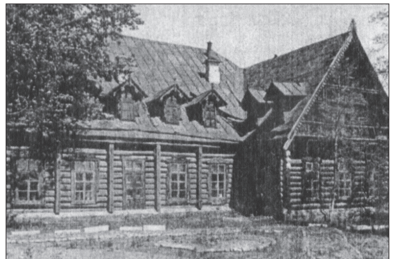
Здание заводоуправления, 1936 год.