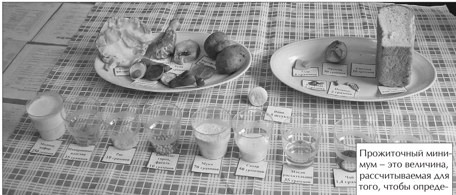
Столько в день можно съесть из расчёта стоимости минимального набора продуктов питания.

Прожиточный минимум с января упал почти на 500 рублей из-за подешевевшей картошки и других овощей.