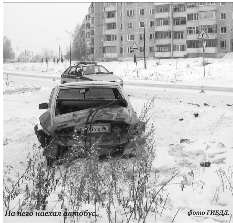
На него наехал автобус.

Водитель автобуса привлечен к ответственности за управление в нетрезвом состоянии и за оставление места ДТП.