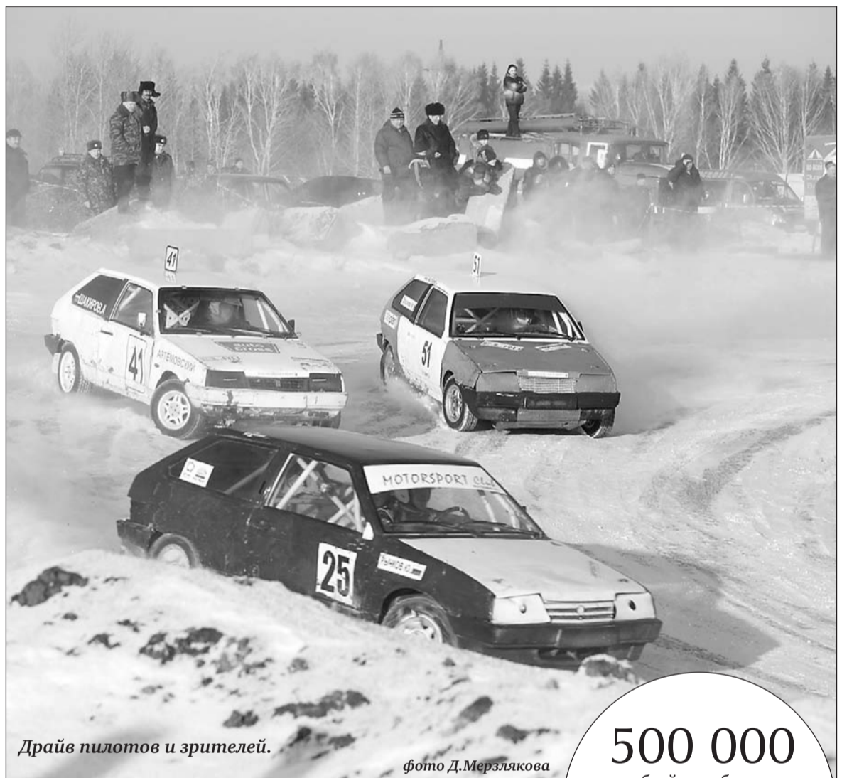
Драйв пилотов и зрителей.

Соревнования по зимнему автокроссу проходят только в Свердловской области. На трассе Нижней Салды в этом сезоне прошли уже две гонки. Последняя – 14 января – финал Чемпионата области.