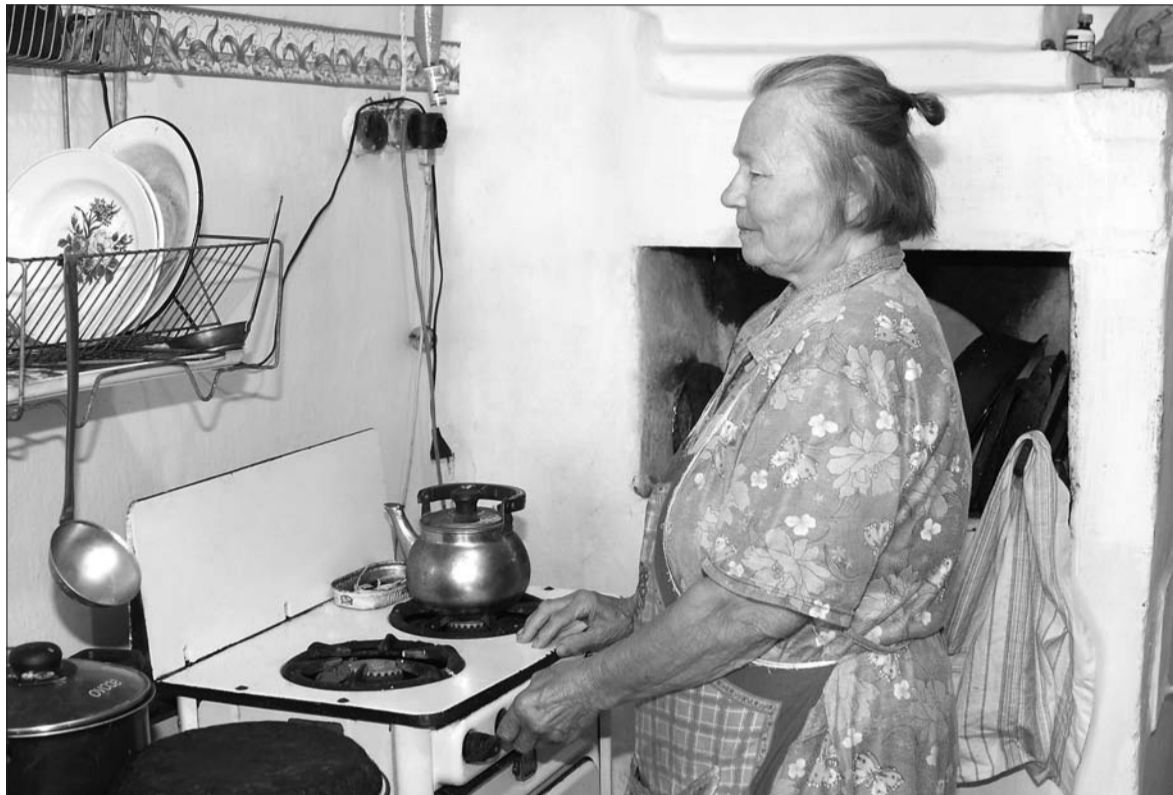
Для пожилых жителей Красной горки подключение к газу – долгожданное событие.

Основным условием пуска газа в дом было своевременное