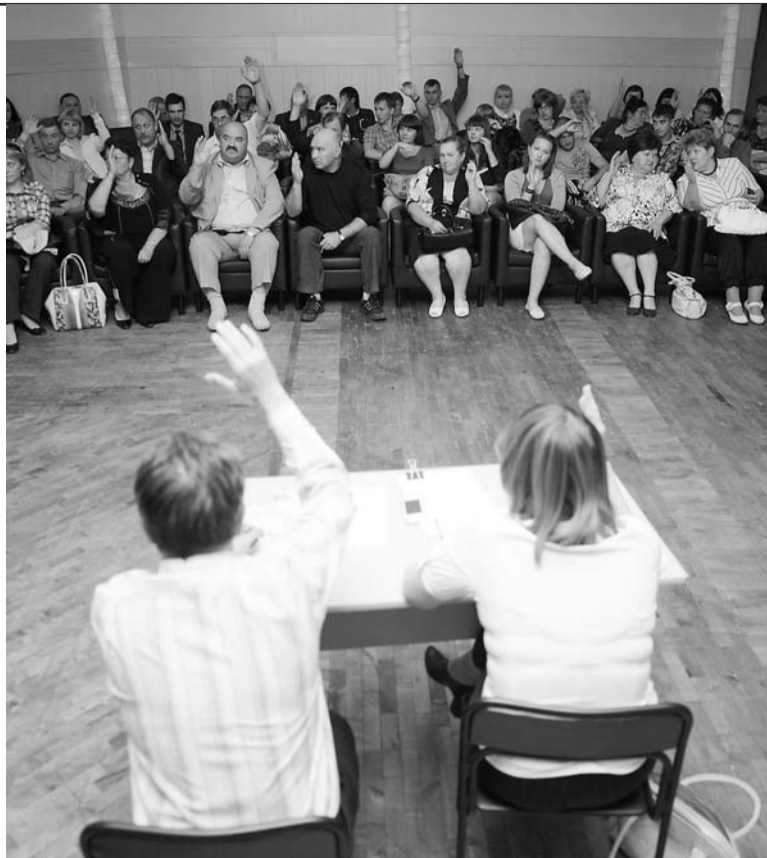
«За» новые Правила проголосовало большинство.

млн рублей заложено в бюджете города на 2012 год по статье «Благоустройство». Большая часть средств уже освоена на основные виды работ: вывоз мусора, обкос травы и др. Если учесть, что только на спилку деревьев требуется сегодня около 20 млн, то для города имеющаяся сумма – капля в море.