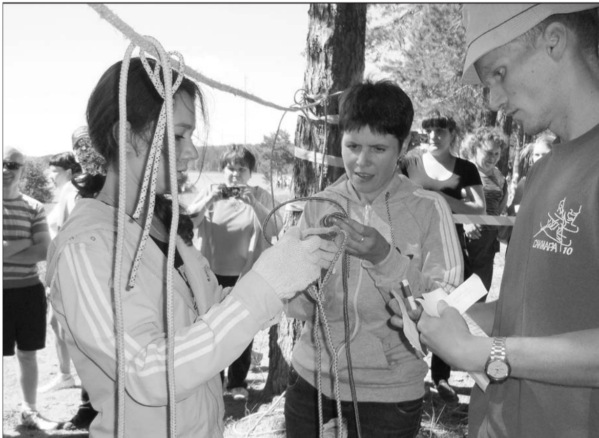
Лучшее итоговое время у сборной 27 и 111 цехов – 1 час 42 минуты, худшее у команды 106 цеха – 5 часов 13 минут.