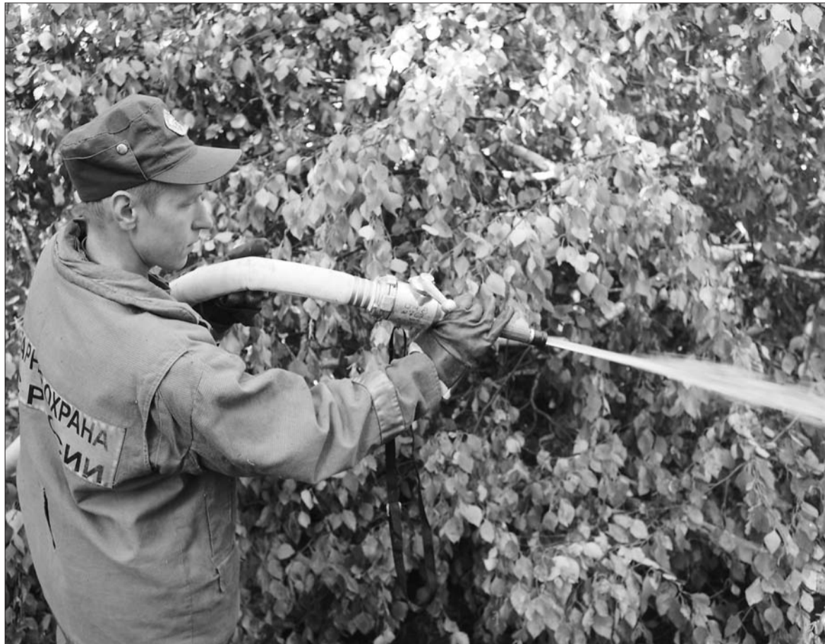
Все силы спасателей брошены на борьбу с лесными пожарами.

На 14-м километре 6 августа тушили лесной пожар общей площадью 1,2 га. Неделю спустя в том же районе огонь поглотил уже 3 гектара леса.