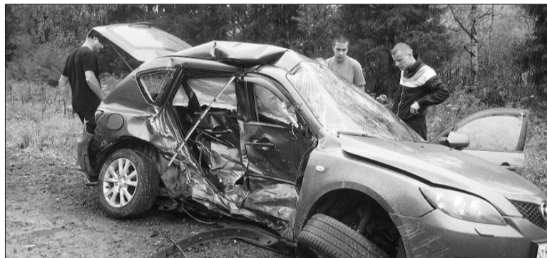
Мазда унесла две юных жизни.

Медики доставили девочку в Детскую горбольницу № 3 Ниж-