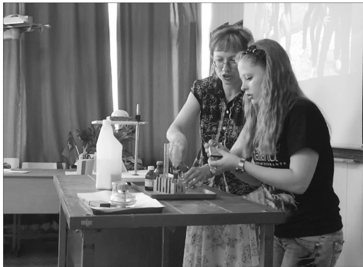
Химичить только в научных целях.

Сын Дмитрия Медведева поступил в МГУ. Конкурс был серьёзный – 23 вуза на 1 место.