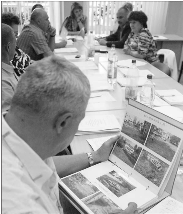
Депутатам представили полный фотоотчёт.