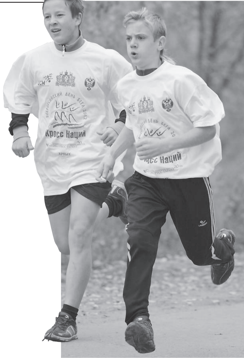
Борьба за медали в спортивном забеге.

Всем бегунам на финише вручили сертификат участника Кросса Наций – 2012, а атлетов спортивного и семейного забегов наградили медалями за 1, 2 и 3 места.