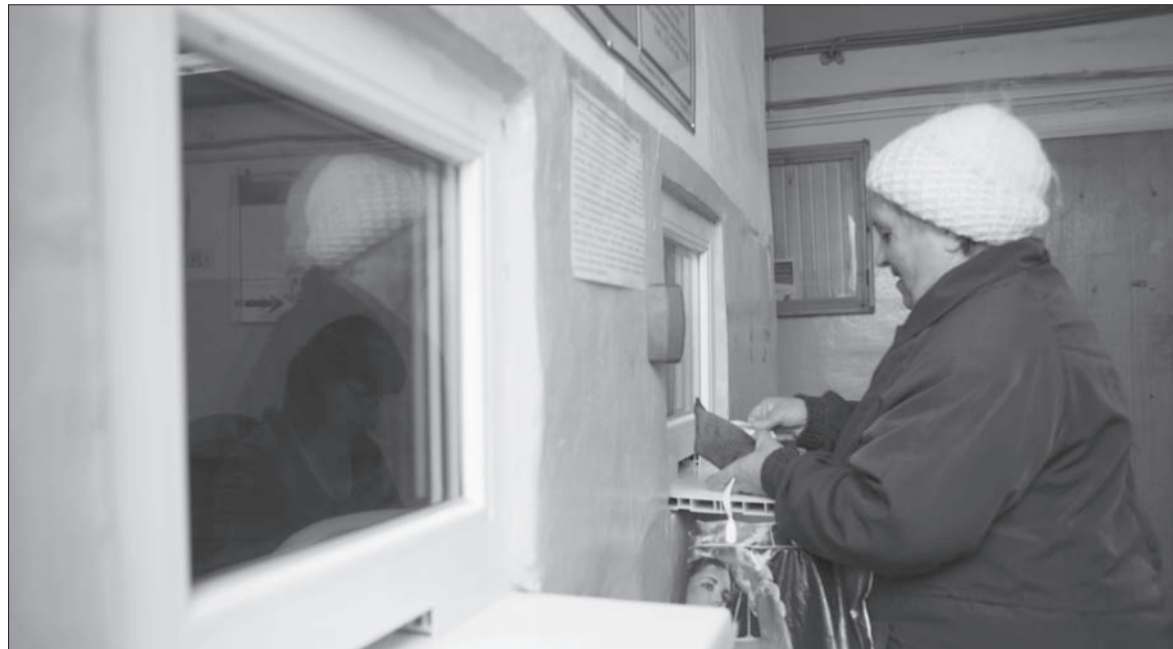
За содержание жилья многие салдинцы переплачивают.