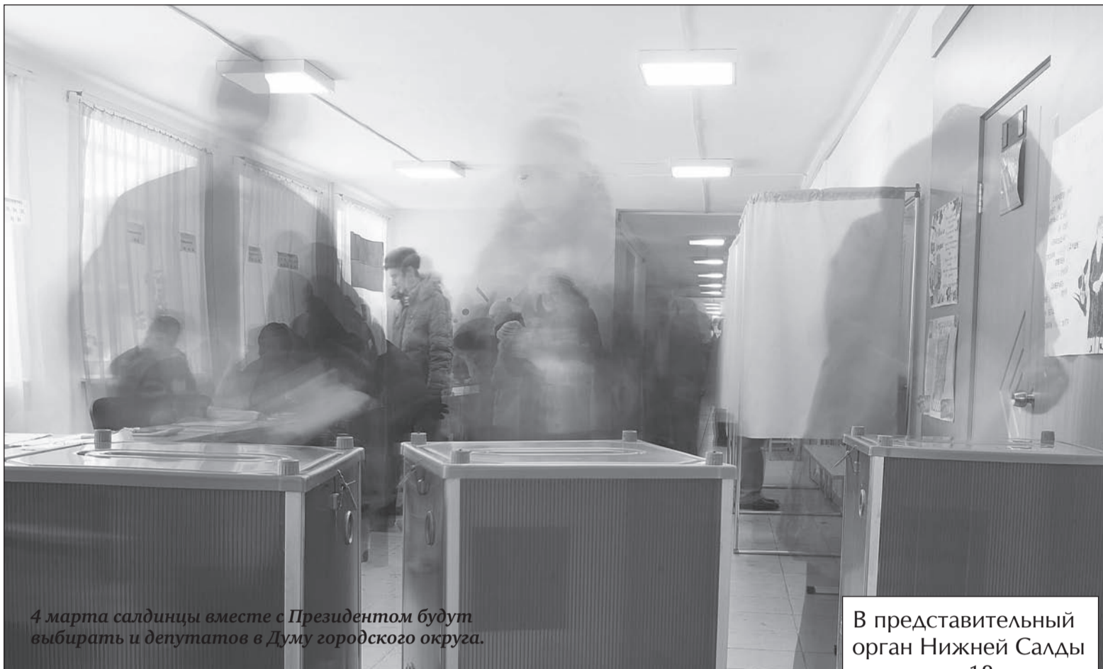
4 марта салдинцы вместе с Президентом будут выбирать и депутатов в Думу городского округа.