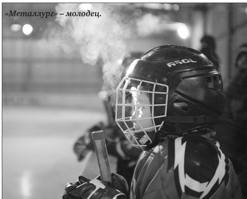
«Металлург» – молодец.

Металлурги 1999-2000 г/р 22 января ездили в В.Туру играть с местной «Молнией» и обыграли их со счётом 6:1. 26 января на своём поле они примут кушвинский «Горняк». Со следующей недели и у этой команды начинается плей-офф.