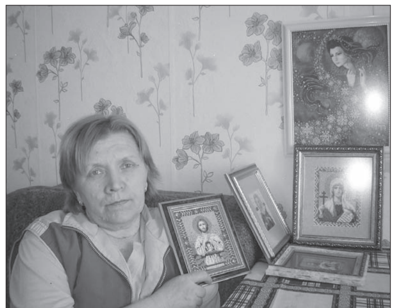
Полюбившиеся образы, насыщенные цвета – и картина в заботливых руках начинает оживать.