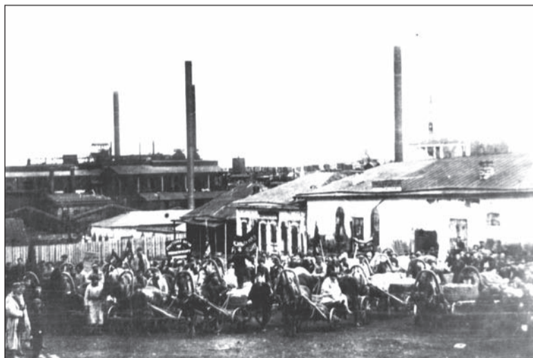
Рыночная площадь, 1929 г. (ныне пл. Свободы).

Если в вашем семейном альбоме есть интересные фото молодой застройки Салды или редкие фотографии со старинными зданиями, которых уже нет, приносите их в редакцию. Построим город заново из фото-кирпичиков!