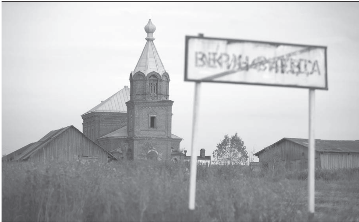
Беспрецедентный случай для Акинфиево.