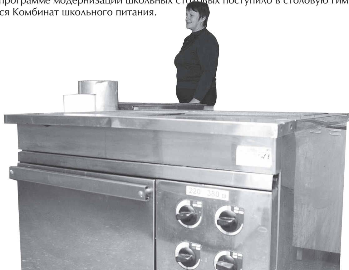
У плит кипит работа, чтобы скоро на них закипели суп или компот.

Мармит – в ресторанном и общественном питании – ёмкость с крышкой, предназначенная для хранения продуктов и готовой пищи в подогретом виде.