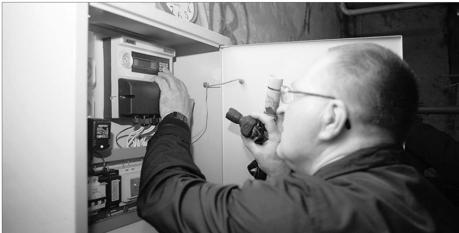
Общедомовой счётчик на порядок точнее квартирного.

Если вы куда-то уезжаете, то перерасчёт за общедомовые нужды вам не сделают. А вот за воду и канализацию в квартире на время отъезда при предоставлении необходимых документов – билетов на самолет и т. д., вам за время отсутствия платить не придётся.