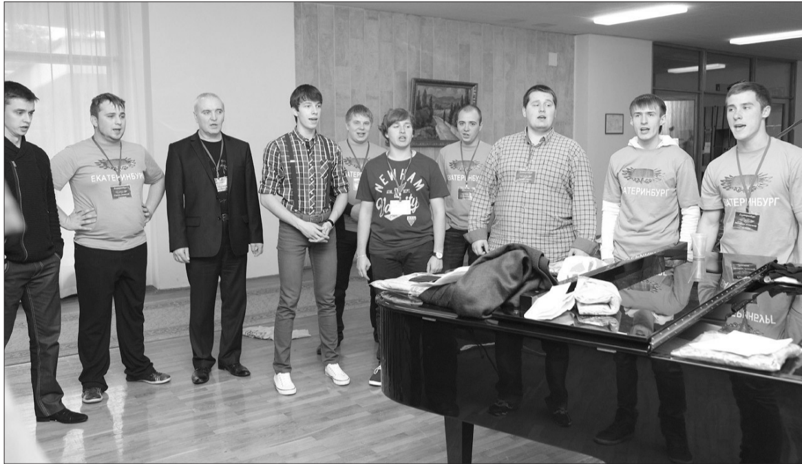
«И, конечно, припевать лучше хором.»

Хор «Виктория», победивший в проекте «Битва хоров», заявил на своей страничке в соцсетях о намерении дать концерт в Екатеринбурге и других городах области. Правда, дата гастролей пока не называется.