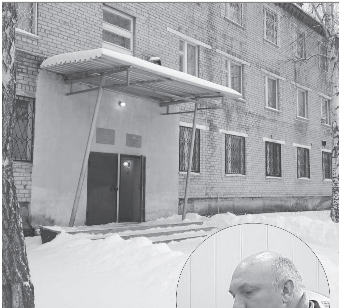
Подарки нельзя брать ни в службу ни в дружбу.