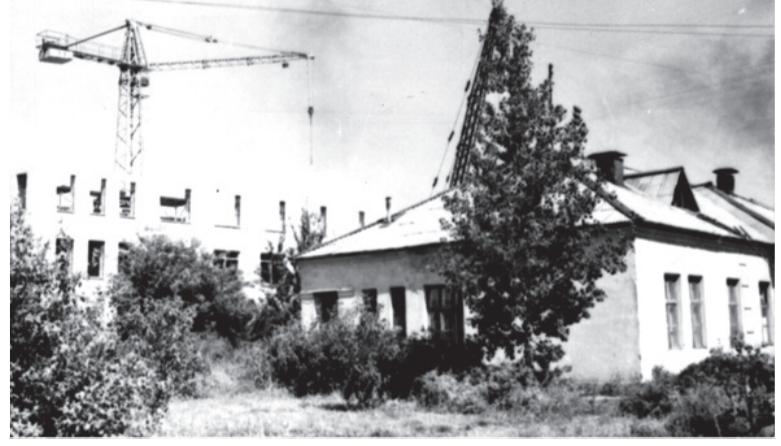
Здание больничного городка, 1957 год.

Старый город Если в вашем семейном альбоме есть интересные фото молодой застройки Салды или редкие фотографии со старинными зданиями, которых уже нет, приносите их в редакцию. Построим город заново из фото-кирпичиков!