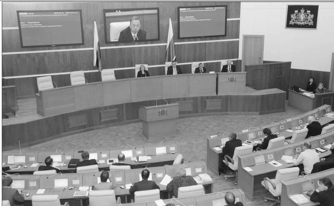
Заседание Законодательного собрания.