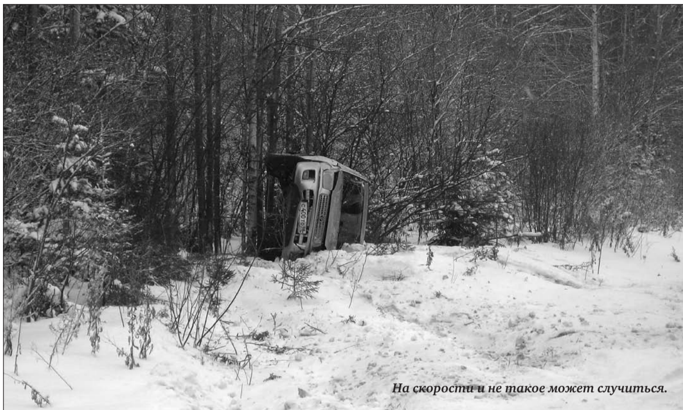
На скорости и не такое может случиться.

Основными причинами ДТП, по мнению инспекторов дорожного движения, являются всё-таки не погодные условия, а неправильный выбор скорости, несоблюдение очередности проезда, а также неоправданный выезд на полосу встречного движения.