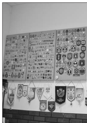
Коллекция значков и медалей – гордость части

«Насосный отсек пожарного автомобиля в полной готовности»