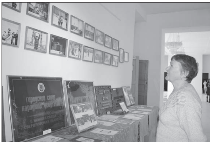
Выставку «По страницам «Городского вестника» теперь можно увидеть в коридорах администрации

Горностаг в природе отличает особая резвость и способность к уничтожению грызунов-вредителей. Надо сказать, общественной жизни не помешала бы резвость, да и вредителей тоже хватает. Так что символ выбран очень верно, осталось пожелать успехов и терпения тем, кто берёт на себя смелость в решении насущных вопросов нашей городской жизни.