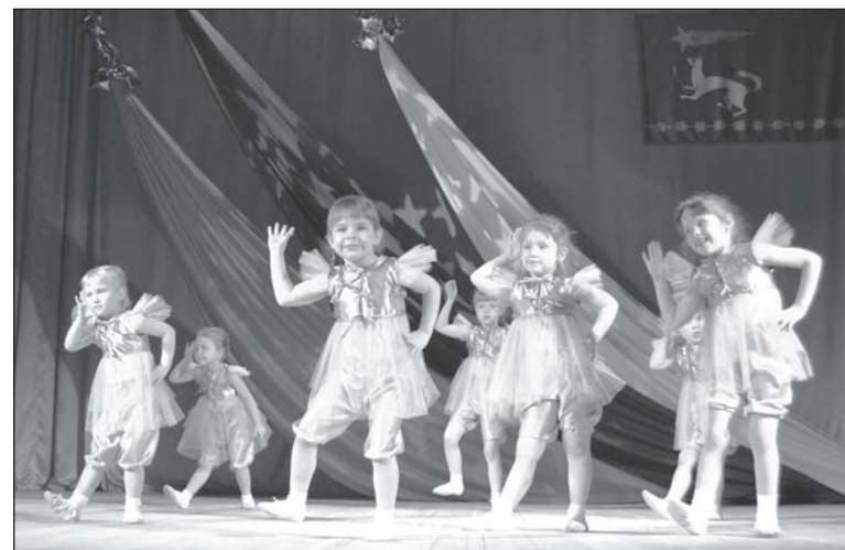
«Карамельки» – украшение праздника