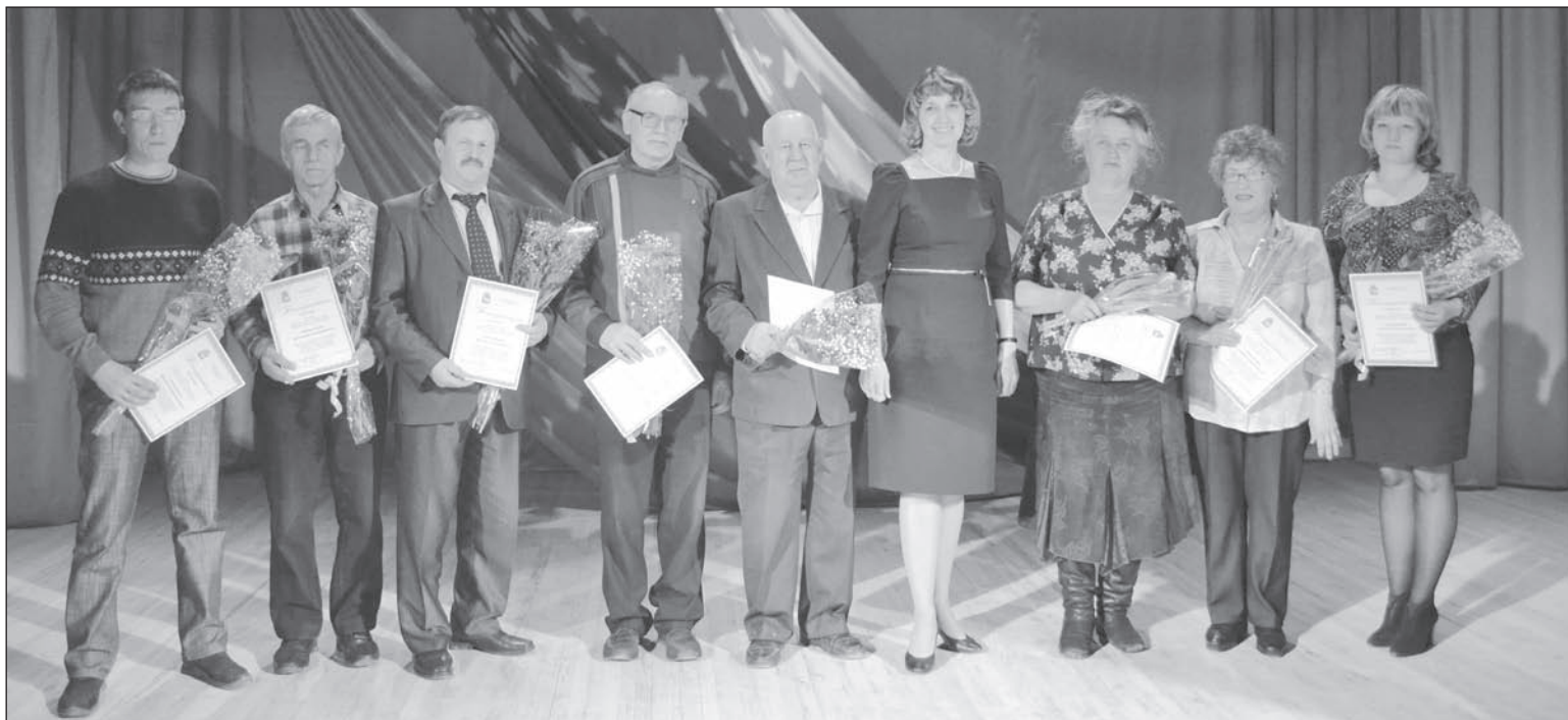
Благодарность от главы округа получили социально-активные жители Нижней Салды

В преддверии Дня местного самоуправления в главном зале Дворца культуры имени Ленина состоялось торжественное мероприятие, на котором были отмечены салдинцы, внесшие наибольший вклад в развитие местного самоуправления