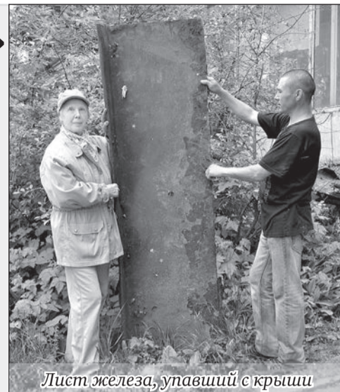
Лист железа, упавший с крыши