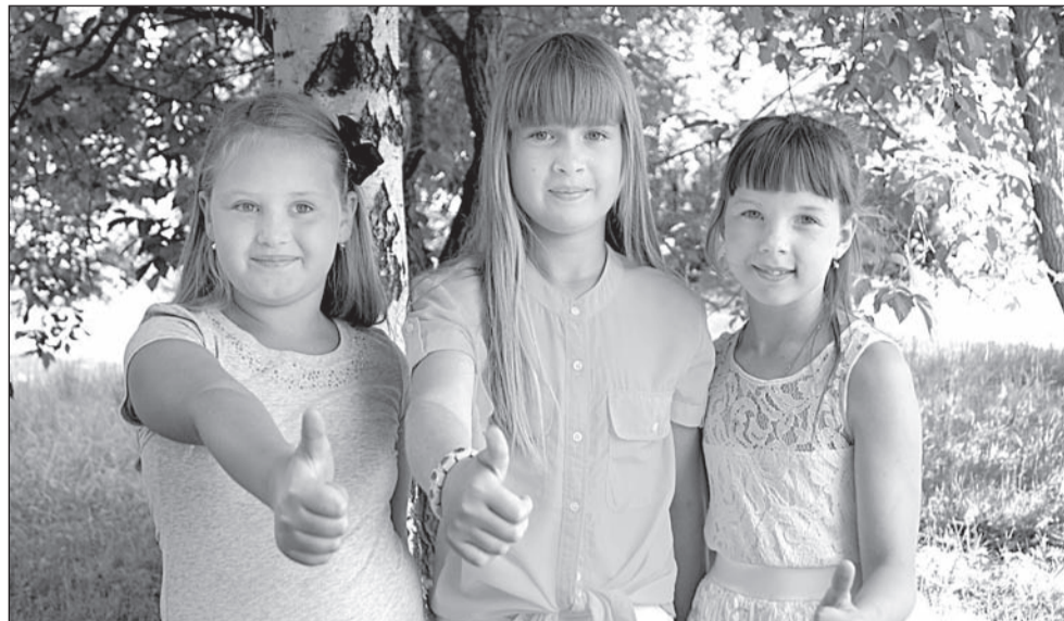
С хорошим настроением из «Жемчужины России»

– Из Анапы привезли! – хвастаются школьники. – А ещё мы захватили с собой морские камушки, ракушки и немного солнышка, чтобы и в Салду жаркое лето пришло!