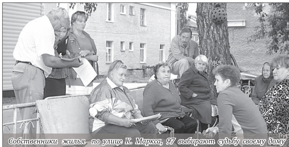
Собственники жилья по улице К. Маркса, 97 выбирают судьбу своему дому