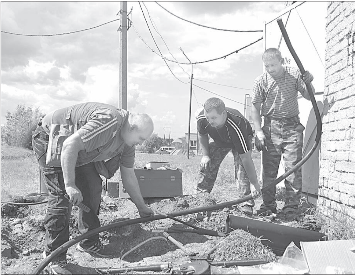
Рабочие уложили более 100 метров нового кабеля

ную аварию удалось устранить, работе МСЧ № 121 она доставила ряд неудобств.