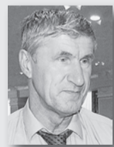
Михаил Копытов, министр АПК и продовольствия Свердловской области:

«Мы ежегодно улучшаем показатели и постоянно находимся в десятке лучших производителей молока в России. Это происходит благодаря стабильной, увеличивающейся с каждым годом областной и государственной поддержке животноводов, грамотной политике, которую ведут руководители сельхозпредприятий в области кормозаготовки и созданию генетического потенциала крупного рогатого скота на Урале».