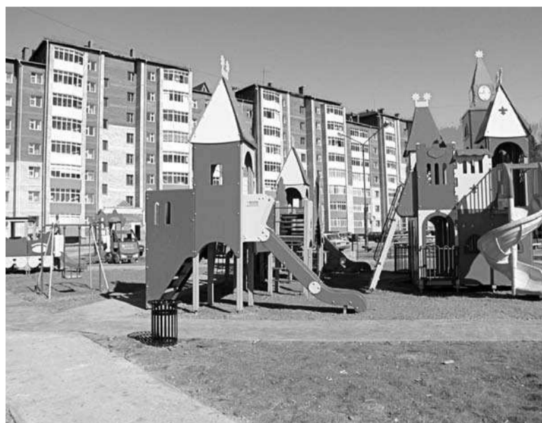
Красивая сказка для детворы нового микрорайона.

Большая часть этих площадок будет оборудована спортивными