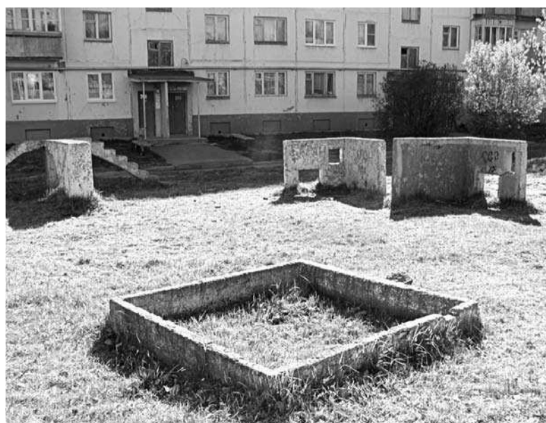
Здесь есть что благоустроить, и подобный двор – не единственный в городе.

В Лесном продолжается установка во дворах жилых домов детских игровых и спортивных комплексов. С 19 мая работники МУП «КБЛ» начали работы во дворе жилого дома № 32 по улице Мира. Далее малые игровые формы будут размещены по следующим адресам: Ленина, 68, 72, 85, 89, 91, 97, 93, Карла Маркса, 7-9, Победы, 38, 40, 46, Бажова, 3, Центральная, 20, 22.