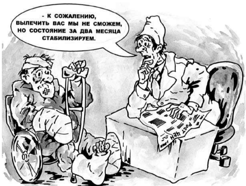
Рисунок Станислава АШМАРИНА.

☺☺☺ Никому не поставь нас на колени! Мы лежали и будем лежать!