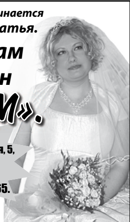
ГРАФИК РАБОТЫ: понеделник-пятница – с 12.00 до 19.00, суббота – с 12.00 до 17.00, воскресенье – выходной.

Адрес: ул. Комсомольская, 5, 2 этаж (со двора). Т. 8-908-914-8965.