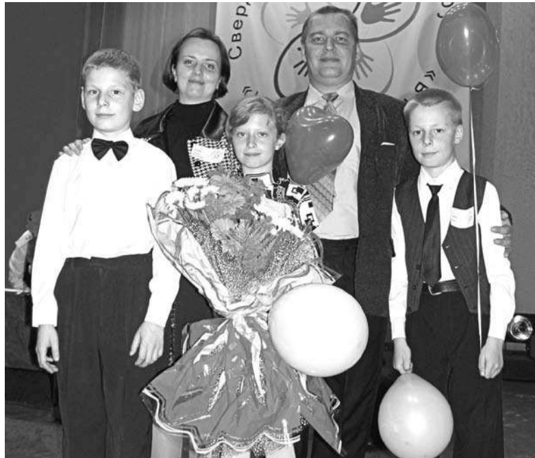
Выдрины – самая счастливая и самая «лучшая приёмная семья».

В рамках форума женщины – многодетные матери были награждены знаками «Материнская доблесть» I и II степени. Бы-