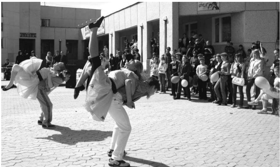
«Стиляги» из 76-й школы – первые в городе, вторые в области.