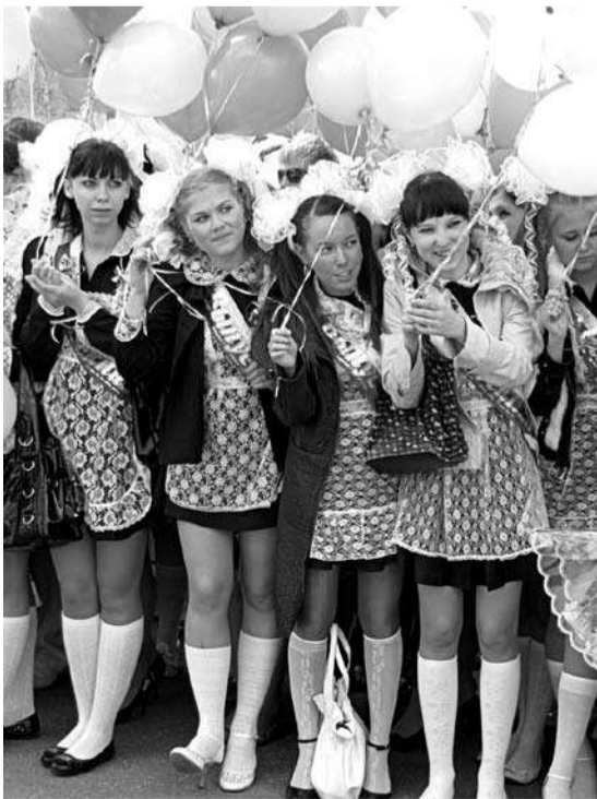
На площади у СКДЦ «Современник».