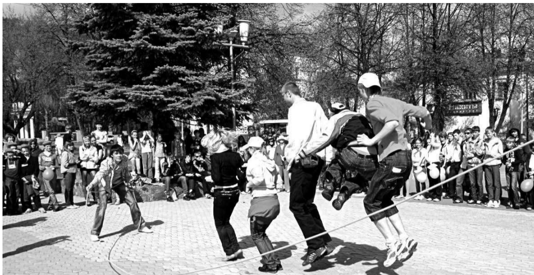
«Поколение» – «БумMIRрангу»: вы – команда?