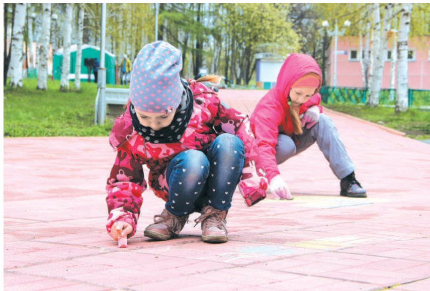
Конкурс рисунков на асфальте в ПКЮ.

ное действо интеллигентный, размеренный тон, позволили книгоманам насладиться развлекательными площадками по вкусу.