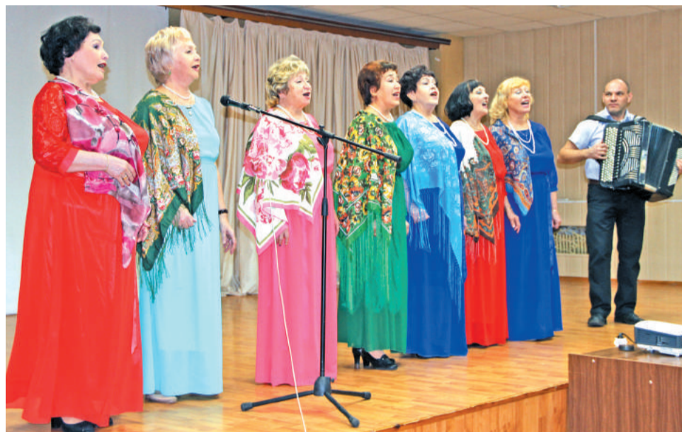
Самодельные коллективы подготовили для общества инвалидов творческий подарок.

Поистине неиссякаемая жизненная сила, радость творчества и созидания, вера в свои силы людей с инвалидностью – во многом заслуга активной работы общества. В 30-летний юбилей мы желаем этой жизнелюбивой общественной организации развития, новых инициатив, вдохновения!