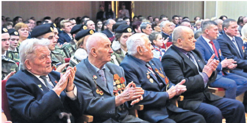
Участники памятного мероприятия – ветераны Великой Отечественной войны и локальных войн, военнослужащие, курсанты и воспитанники военно-патриотических объединений.

Сразу после завершения митинга стартовал автопробег, уже во второй раз организованный сотрудниками СУ ФПС № 6 МЧС России. В нём приняли участие семь пожарных машин. На каждый автомобиль были прикреплены баннеры с фотографиями Героев Великой Отечествен-