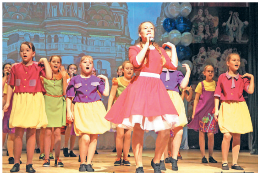
В исполнении вокальной студии «Город детства» звучит песня «Нарисуй этот мир».