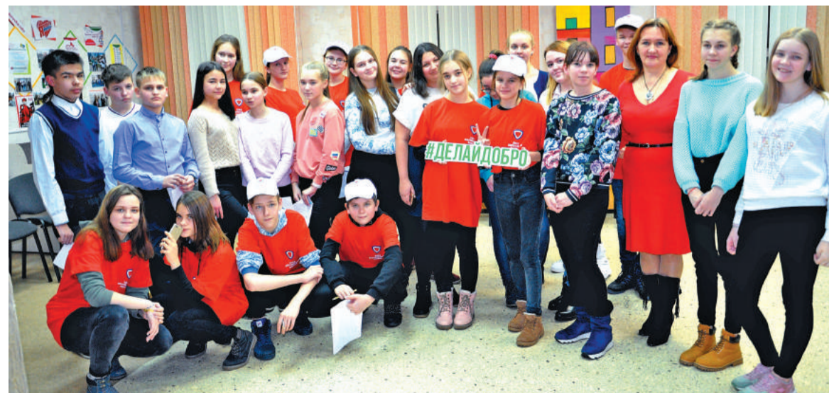
Участники тренинга «Круг доверия».

Таким ярким акцентом «Гайдаровка» завершила цикл мероприятий, посвящённых Году добровольца в России. Однако на этом история арт-волонтерства в Детской библиотеке точно не закончится. Впереди – много новых интересных, добрых, удивительных свершений!