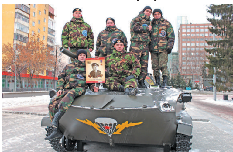
Отряд «Разведчик» - участник областной патриотической акции.