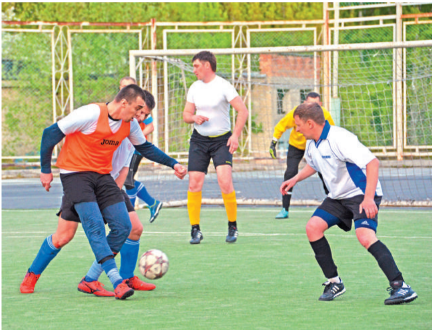
«Спутник» прорывается к воротам команды «Витязь».

27 мая завершились соревнования по мини-футболу в зачёт Спартакиады молодёжи. Стартовал турнир 13 мая, в нём приняли участие 12 команд, сыгравшие в двух группах по круговой системе.