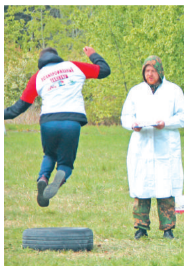
Этапы «Весёлых стартов» участники преодолевали с азартом.