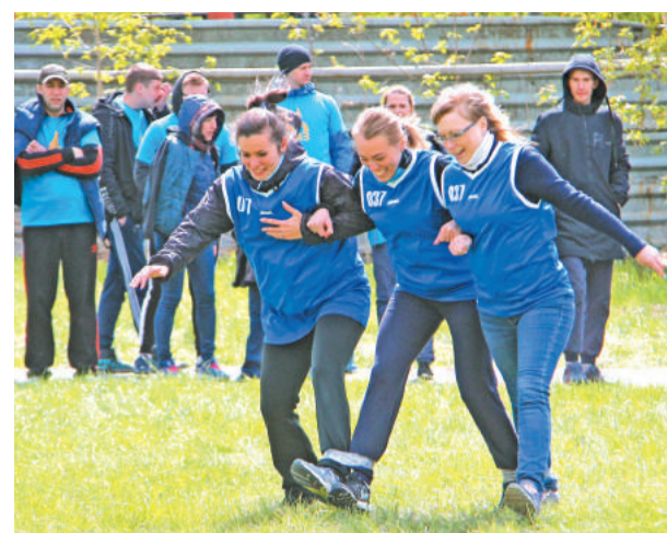
Технологи комбината «Электрохимприбор» – в одной связке.