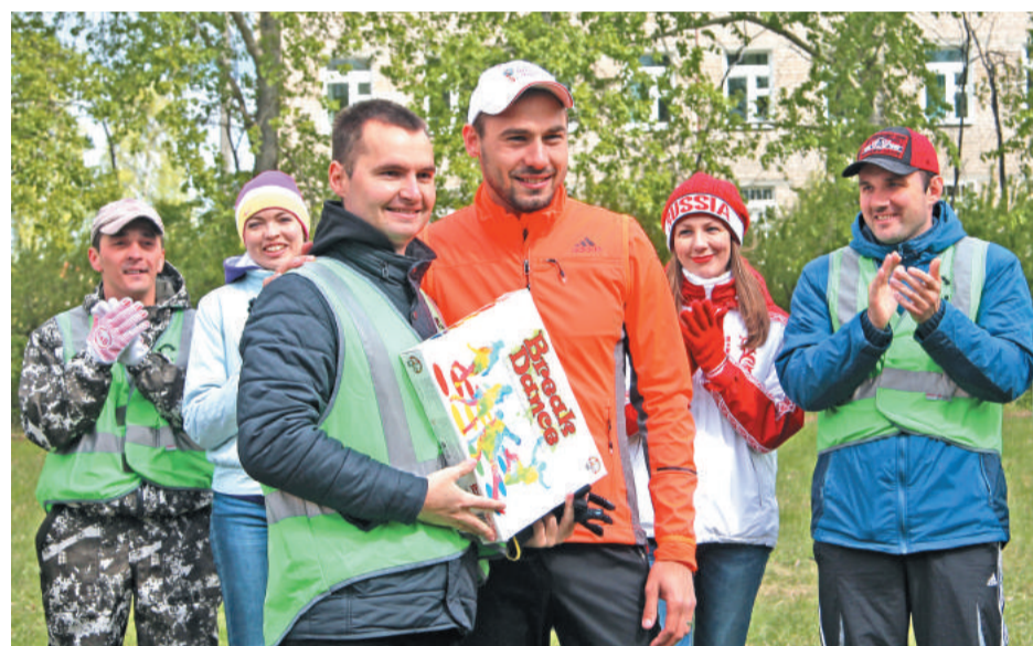
Сделать фото с именитым биатлонистом – такую возможность не упустил никто!