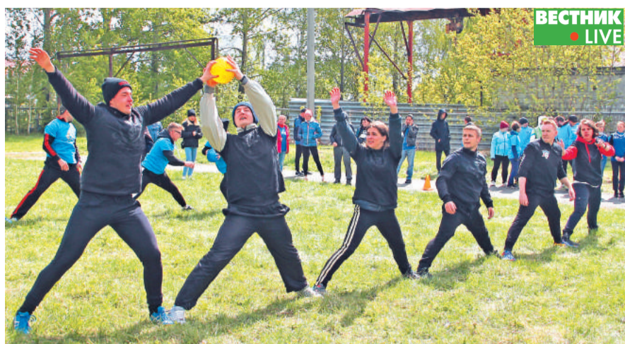
Участники мероприятия демонстрировали хороший уровень физической подготовки и умение действовать в команде.