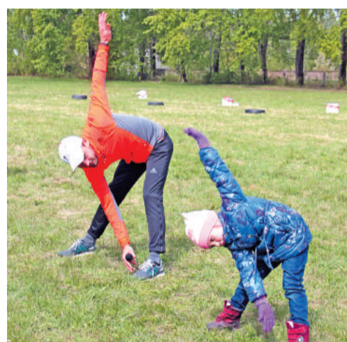
«Мельница» вместе с чемпионом.

В субботу, 24 мая, на стадионе Полипрофильного техникума состоялись традиционные весенние «Весёлые старты» молодёжной общественной организации комбината «Электрохимприбор»