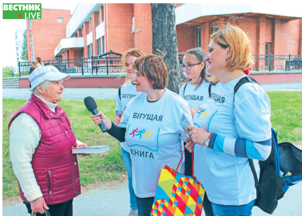
По итогам интеллектуального забега пятьдесят книг обрели своих читателей – были подарены прохожим за правильные ответы.

По итогам всероссийской социокультурной акции «Территорией культуры Росатома» будет смонтирован фильм о проведении «Бегущей книги» в 2019 году во всех уголках России. Ролик будет выложен в открытом доступе на видеохостинге YouTube. Подробнее – на сайте бегущаякнига.рф.