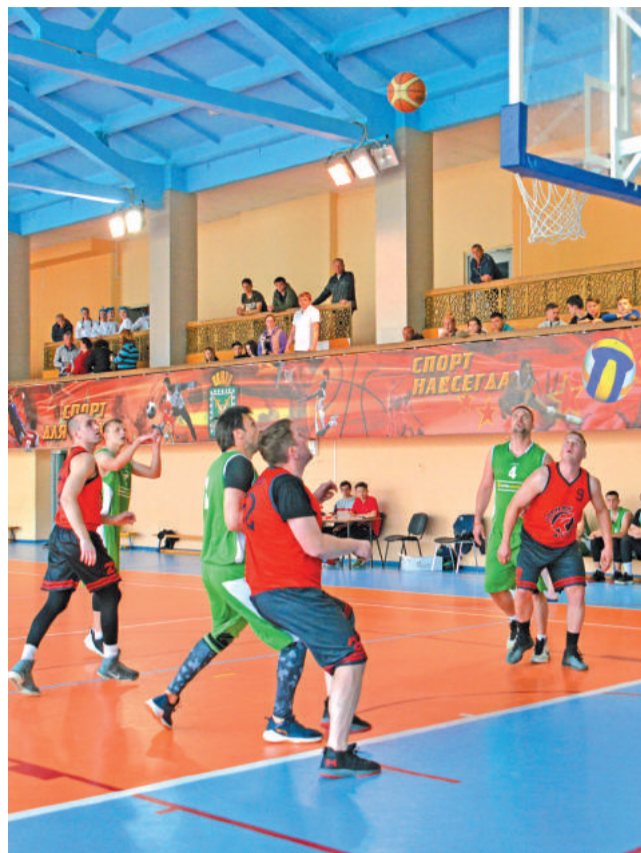
Матч Лесной – Кушва. В нападении – лесничане.