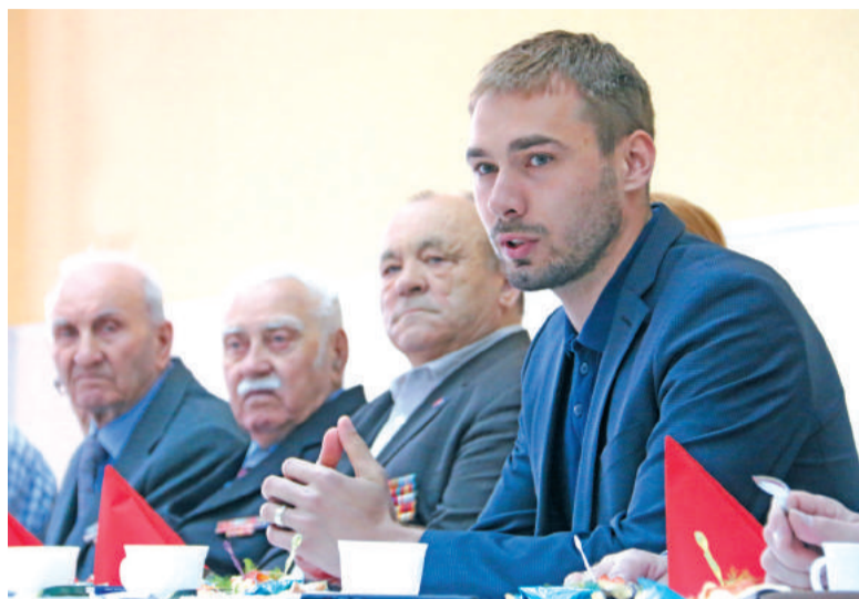
В литературной гостиной библиотеки имени П.Бажова, за чашкой чая, биатлонист пообщался со старшим поколением Лесного.