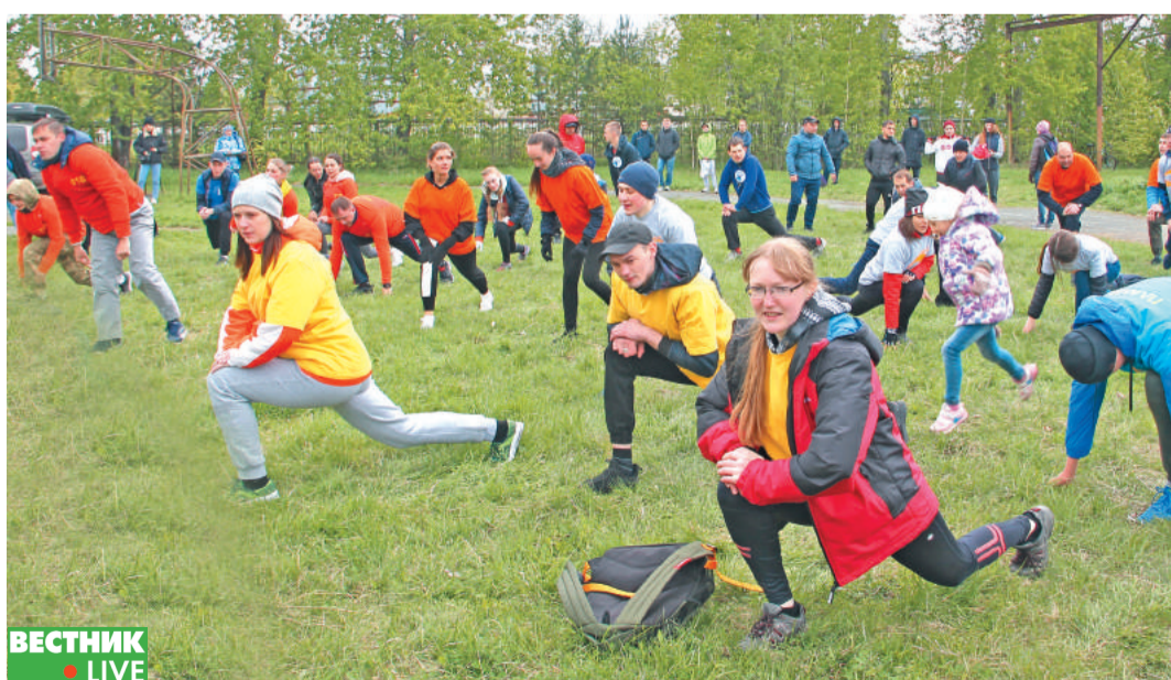
Традиционная разминка перед стартами.