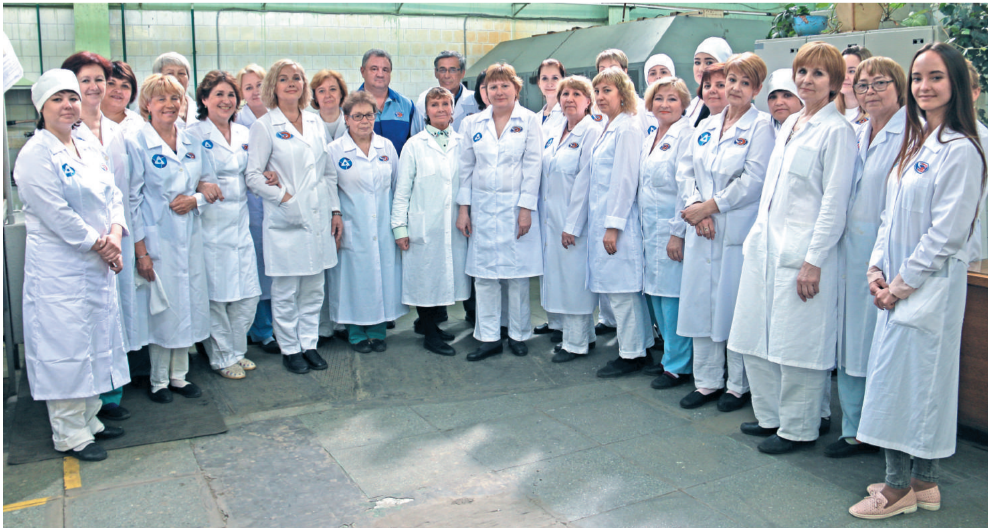
Коллектив химического отделения цеха 001.