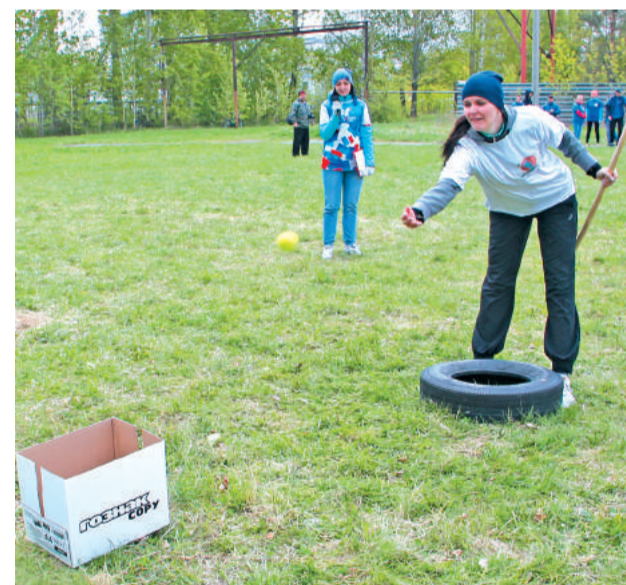
Один бросок – и точно в цель!