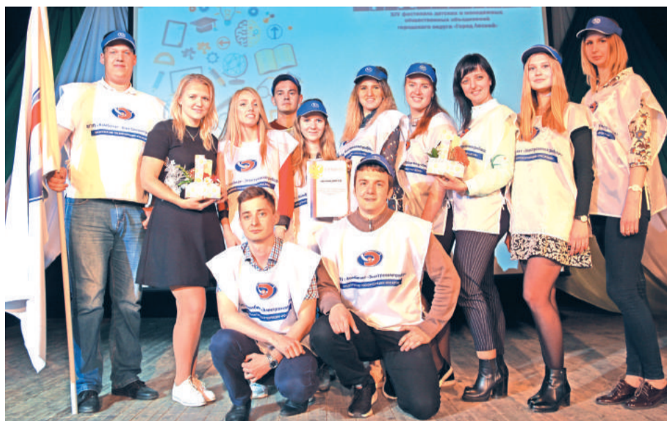
Победители квиз-игры «АктивиУМ» – команда МОО комбината «Электрохимприбор».

Такие встречи необходимы для молодёжи. Они развивают, объединяют и не дают сидеть на месте! Они делают жизнь ярче, веселее и разнообразнее, вдохновляя молодёжь Лесного на новые увлекательные проекты и только добрые дела.