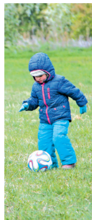
Растим будущих олимпийцев!

Своей цели – привлечь внимание работников комбината «Электрохимприбор» к двигательной активности – организаторы стартов достигли, ведь физические упражнения в хорошем настроении – это отличный способ быстро согреться, например, в такой весенне-снежный день, какой была прошедшая суббота.