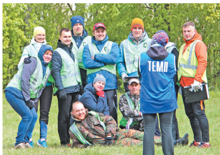
Жюри «Весёлых стартов».