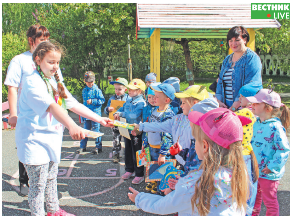
Д/с «Золотой петушок» дружит с детской библиотекой уже несколько лет и с удовольствием принимает участие в проектах «Гайдаровки».