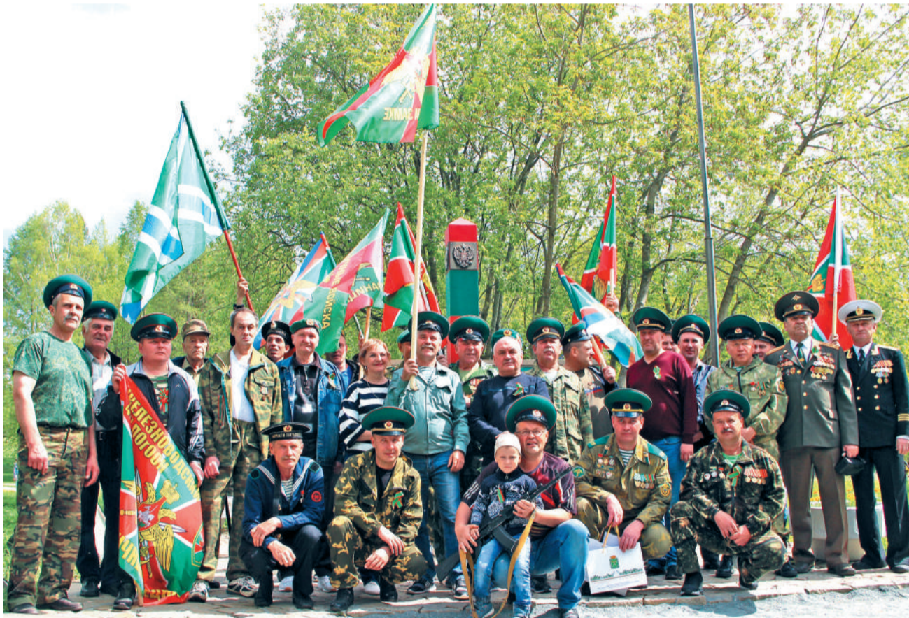
После митинга – фото возле памятного знака, установленного силами Союза пограничников Лесного и уже ставшего одной из любимых достопримечательностей горожан.

ценное в работе то, что ветераны-пограничники пристальное внимание уделяют работе с подрастающим поколением. Ведь работа по патриотическому воспитанию детей и молодёжи очень важна, и неоценимую роль в этом играют существующие в нашем городе традиции воинства, братства и единства.