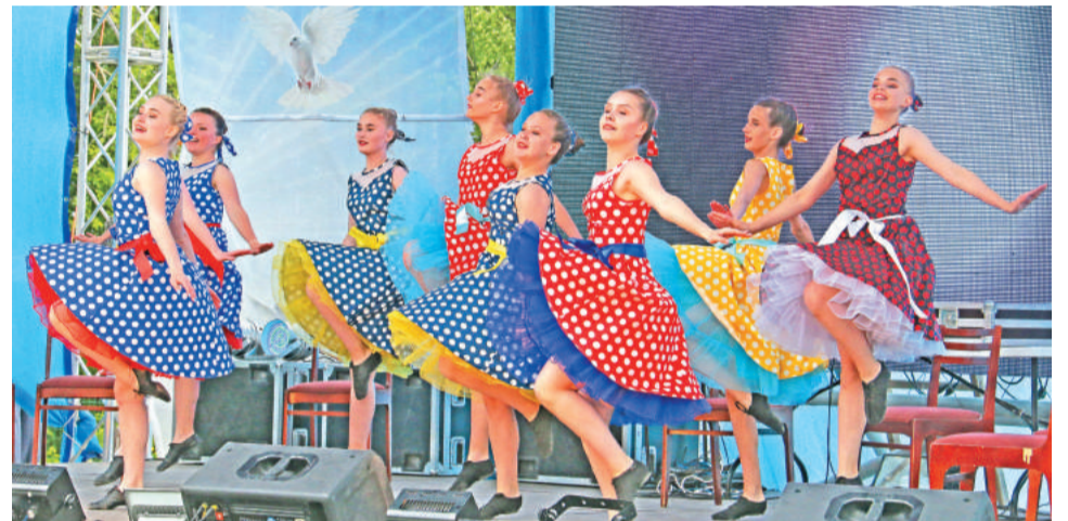
Зажигательный танец в исполнении воспитанниц хореографического коллектива «Три Т» Центра детского творчества.

Что ж, семьдесят третья страница книги жизни нашего родного города и комбината «Электрохимприбор» открыта. Остаётся только добавить: процветай и здравствуй, Лесной!