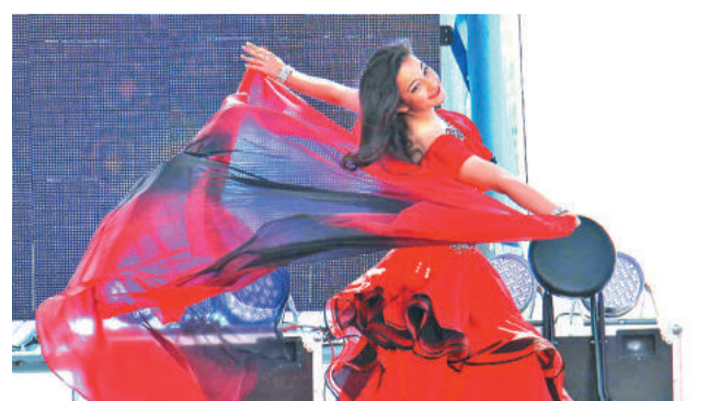
На сцене - красота и грация.

В ОДНУ СТРОКУ: За годы существования Лесного звание «Почётный гражданин города» было присвоено заслуженным людям 54 раза.