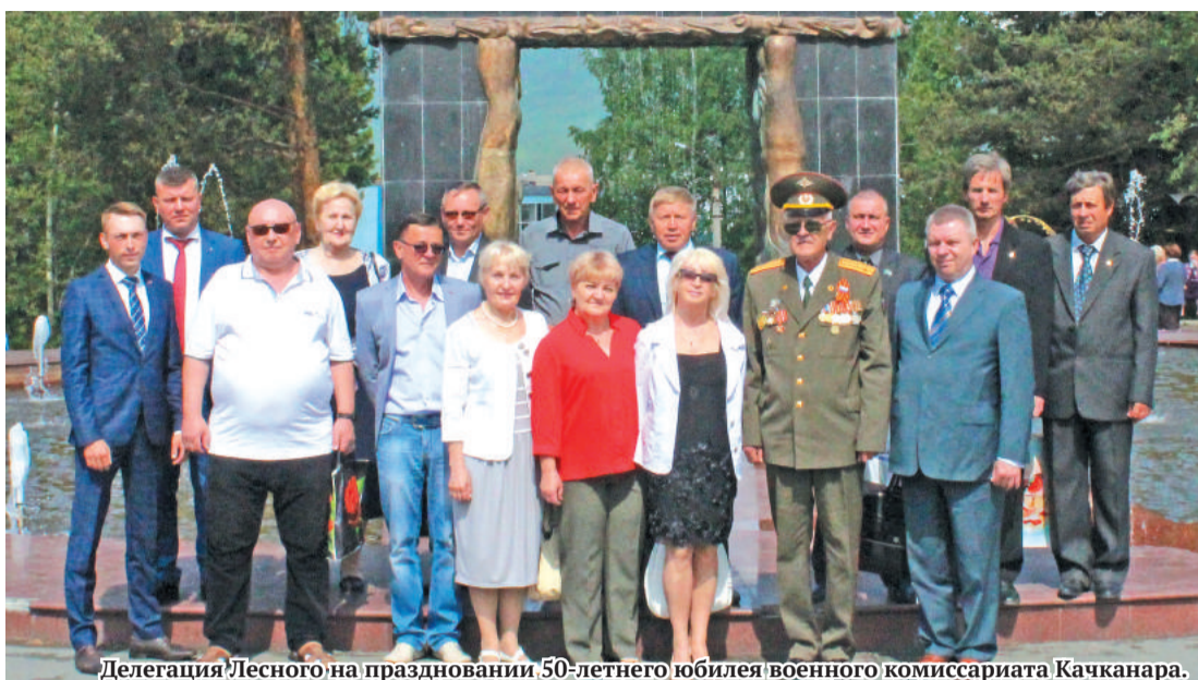
Делегация Лесного на праздновании 50-летнего юбилея военного комиссариата Качканара.

Самым главным событием встречи стала церемония награждения. Чествовали ветеранов военных комиссариатов, сотрудников военно-учётных столов, военно-учётных работников предприятий, организаций, вузов и техникумов, представителей общественных организаций, начальников штабов Юнармии, педагогов и медиков. Все они внесли большой вклад в развитие военных комиссариатов, а значит, и в решение важнейших государственных задач по обеспечению обороноспособности страны. Большое внимание уделяется работе по военно-патриотическому воспитанию населения, профессиональной ориентации допри-