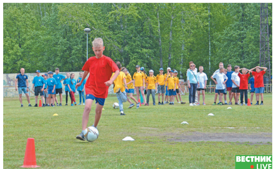
«Весёлые старты» среди воспитанников городских лагерей.