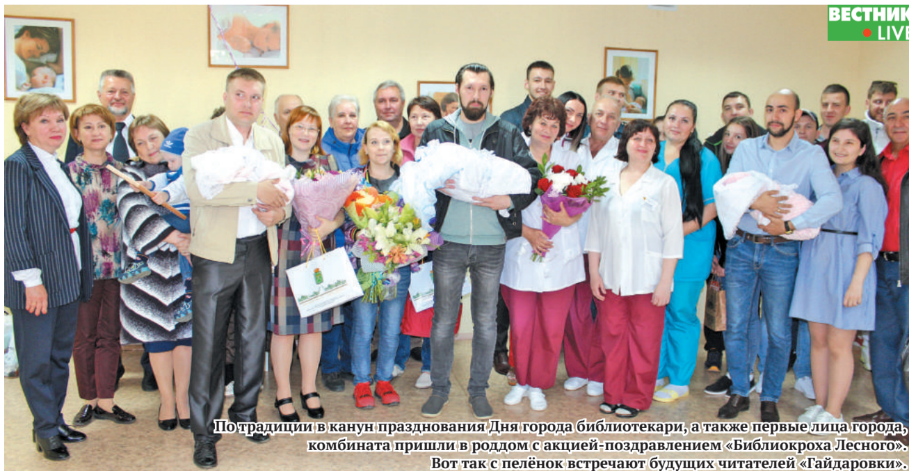
По традиции в канун празднования Дня города библиотекари, а также первые лица города, комбината пришли в роддом с акцией-поздравлением «Библиокроха Лесного». Вот так с пелёнок встречают будущих читателей «Гайдаровки».

Доброй традиции проведения акции «Библиокроха Лесного» – уже двенадцать лет. Все участники акций разных лет являются читателями «Гайдаровки». Буквально с пелёнок ребятам приучаются к чтению и вместе с книгой открывают для себя большой и такой интересный мир. И теперь к ним присоединились новые библиокрохи Лесного!