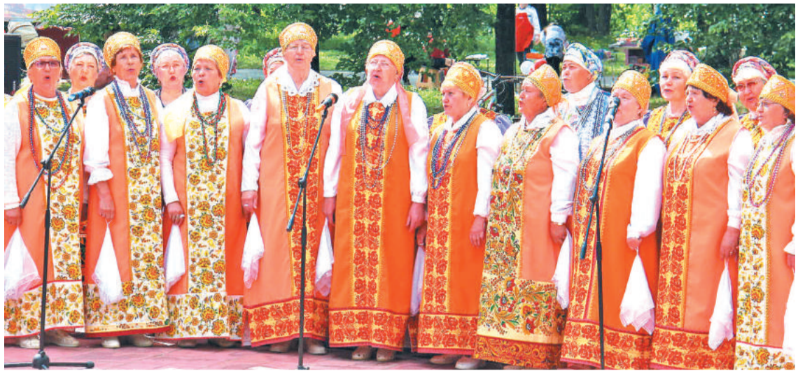
У павильона развлечений работала площадка «Серебряный возраст».