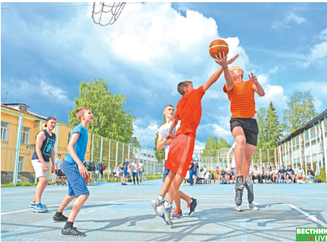
Стритбол, играют команды юношей до 18 лет.