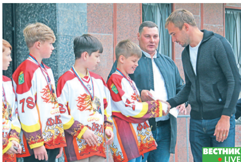
Юные хоккеисты Лесного принимают поздравления от Антона Шипулина.