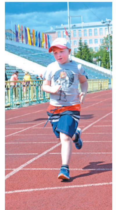
Буду быстрым, как папа!

кел», ДЮСШ и ДЮСШ единоборств. Мастер-классы прошли также при поддержке СК «ENERGYM», представители спортивного клуба работали на трёх этапах и предоставляли на них призы.