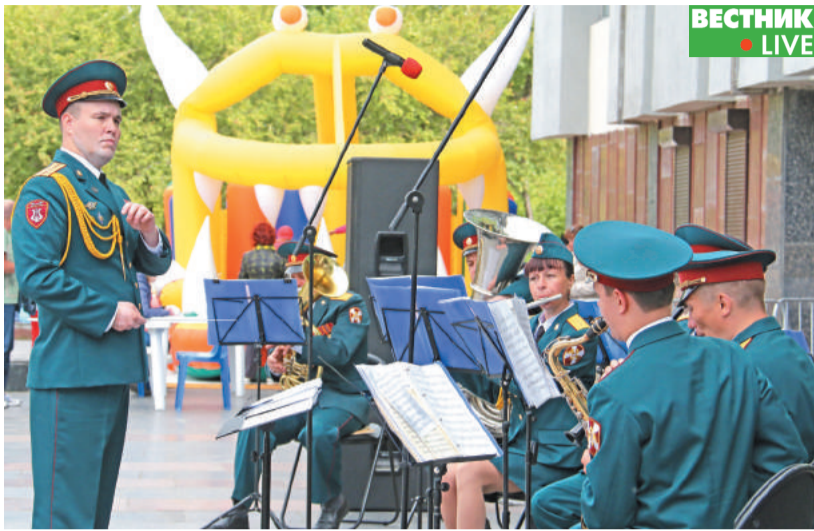
Выступление духового оркестра в/ч 3275 у «Юности».