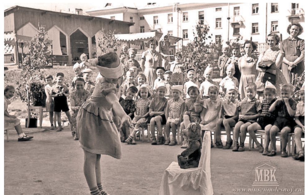
Выпускной утренник в детском саду, 1960 г.

Как раньше проходили выпускные праздники в детских садах