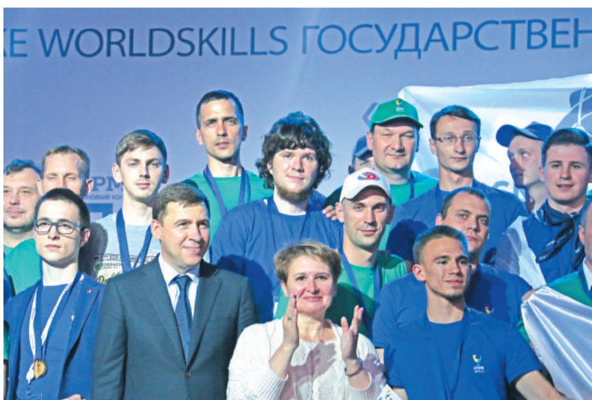
Победители чемпионата профессионального мастерства «AtomSkills-2019» с губернатором Свердловской области Евгением Куйвашевым.