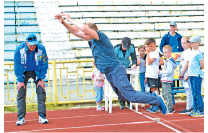
Прыгают все! Мастер-класс.