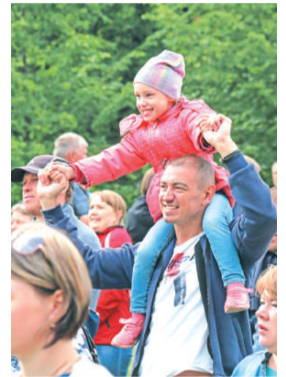
Лесной вновь наполнял сердца радостью, дарил позитив!