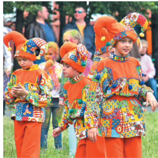
Настроение горожанам задавали весёлые скоморохи.