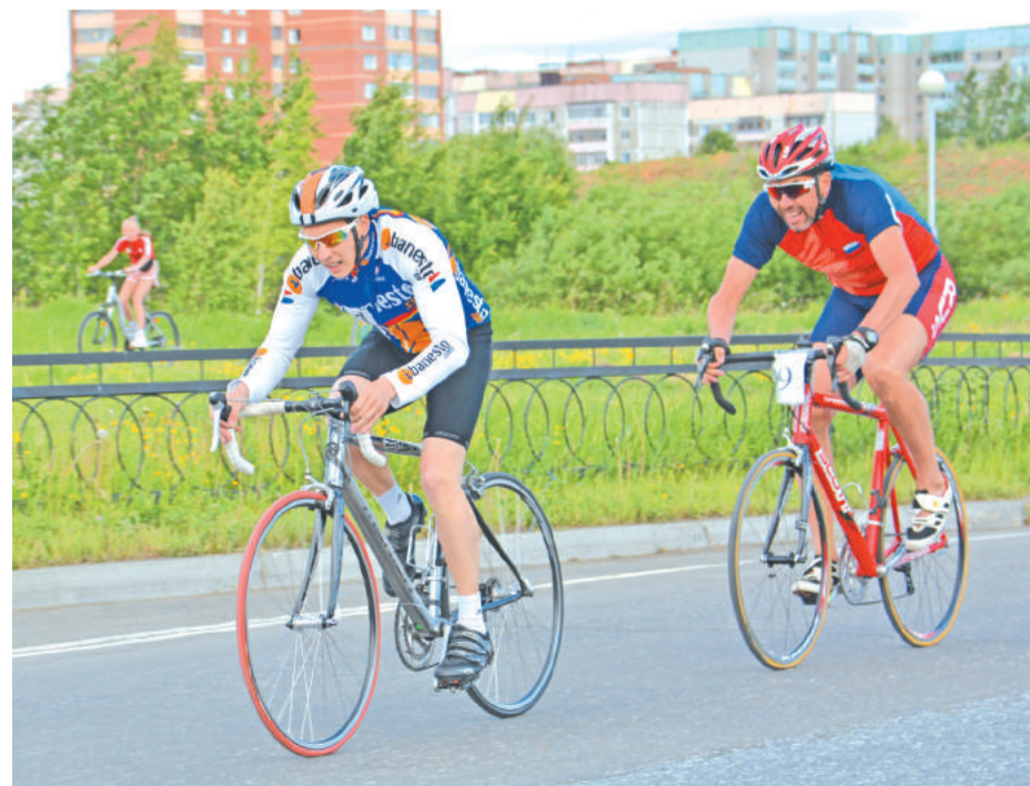
Отчаянная борьба, впереди – «Прометей», следом – «Факел-1».