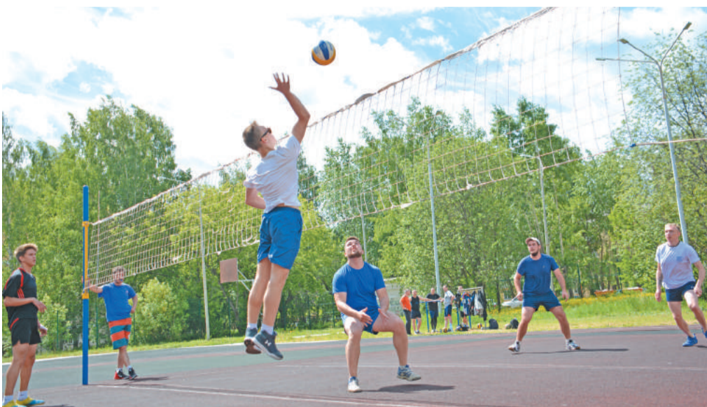
Турнир по волейболу – на стадионе Лицея.