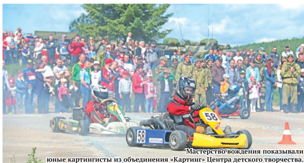
Мастерство вожделения показывали юные картингисты из объединения «Картинг» Центра детского творчества.