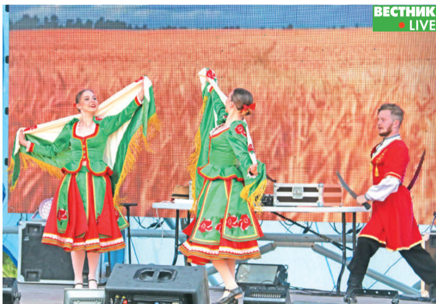
На сцене – танцевальный коллектив «Правило буровчика».