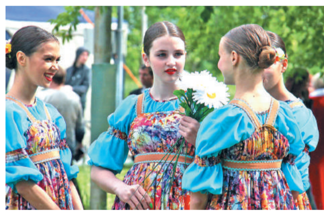
Трогательные, нежные, юные жительницы Лесного.