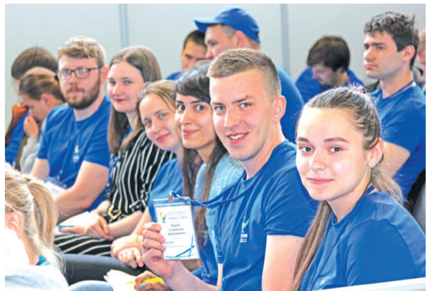
Росатом – это мы!