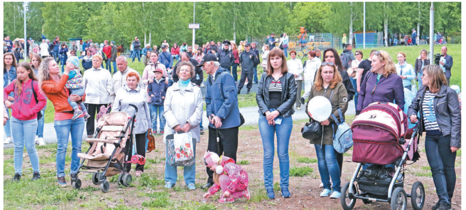
Насыщенная программа Дня города и комбината сплотила лесничан вместе. Праздник получился с размахом!