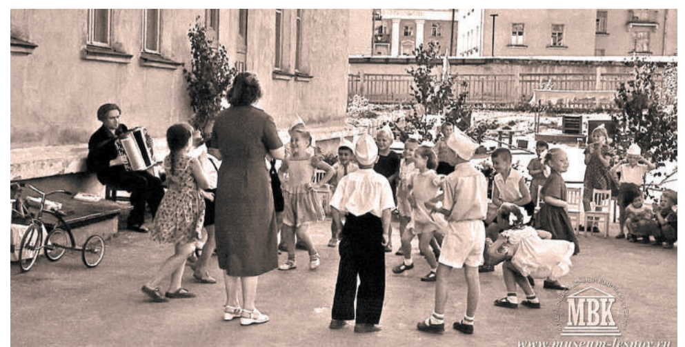
Воспитатели старались сделать выпускной утренник незабываемым. Проводили подвижные игры, конкурсы, дружно исполняли под баян песни о школе. Аккомпаниатором часто приглашали шефов или кого-то из родителей.

ФОТОГРАФИИ С.Е. ФЕДОРОВСКОГО ИЗ АРХИВА МУЗЕЯ, 1960 ГОД.