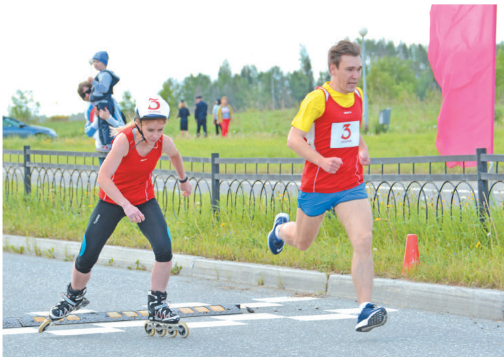
7 этап – команда «Знамя».