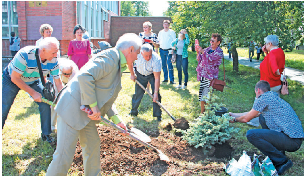
Многолетняя традиция – совместная посадка голубой ели всеми участниками праздника. Эта ёлочка – девятая по счёту.