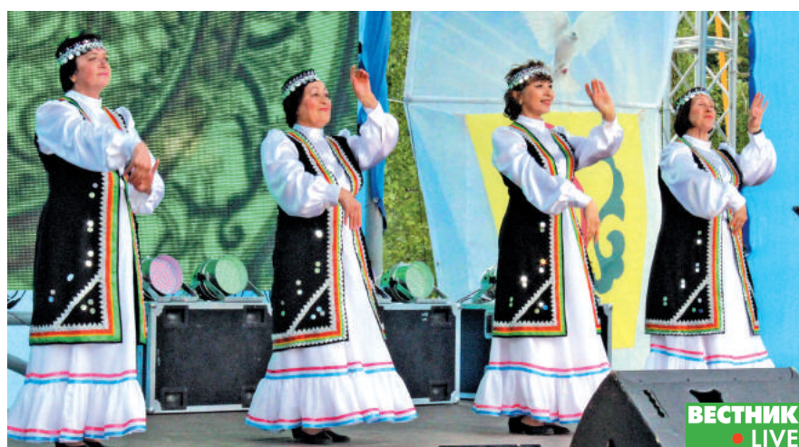
Глядя на почти неуловимые глазом движения рук танцовщиц зрители непроизвольно начинали пританцовывать или хотя бы кивать в такт музыке.