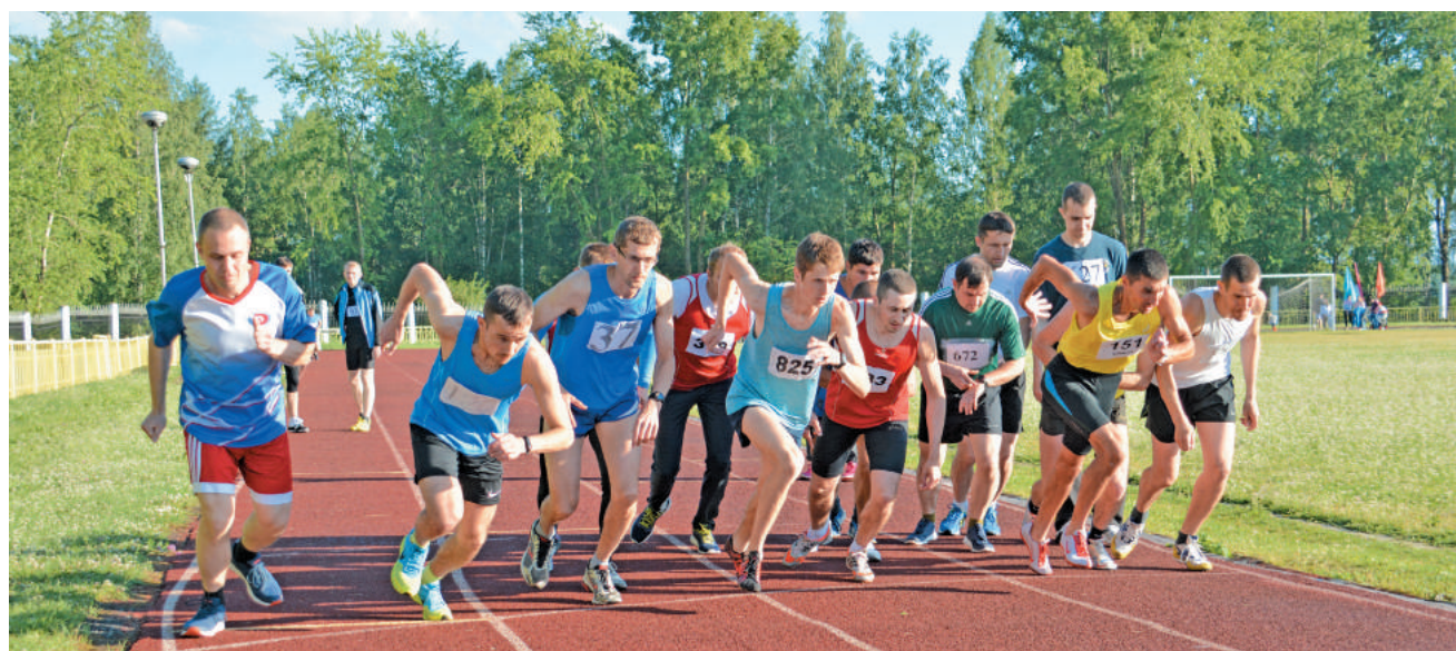
Старт сильнейшего забега на 3 000 м