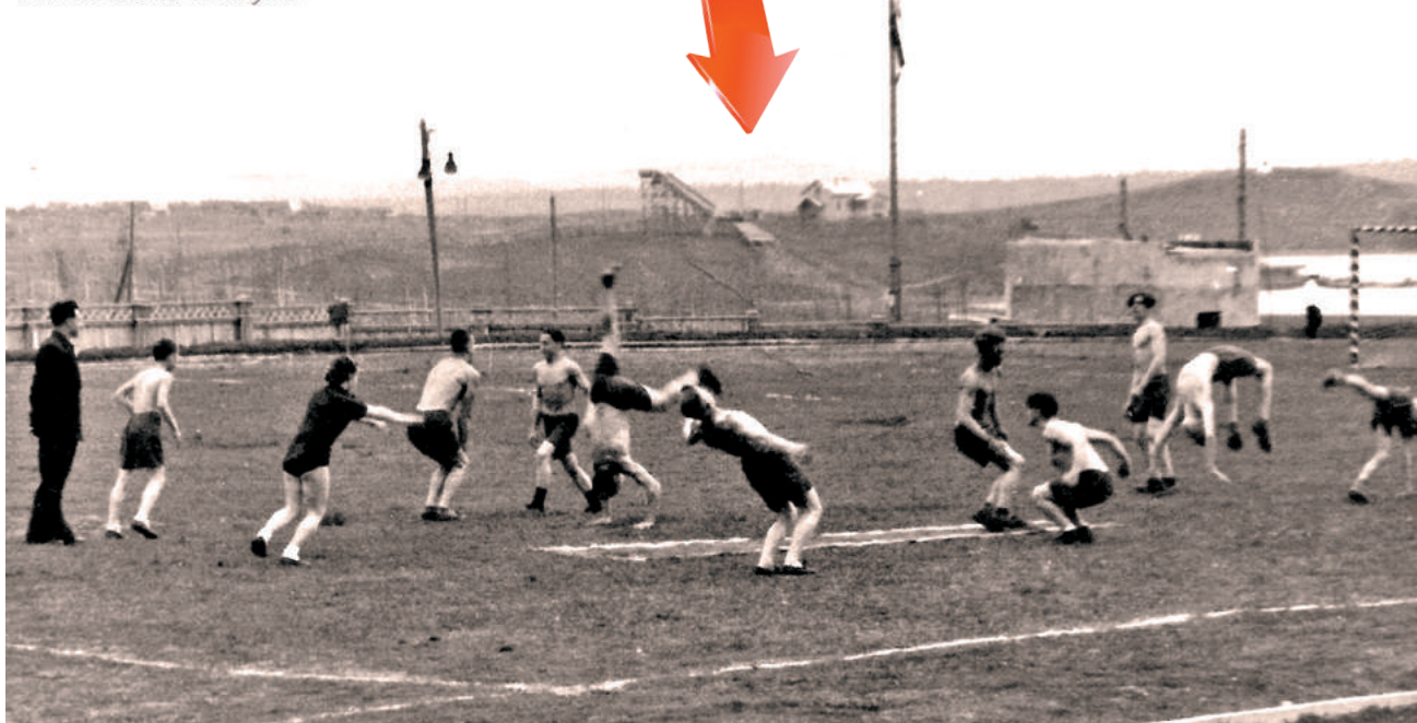
Выступление акробатов, стадион «Химик», 1954 год.