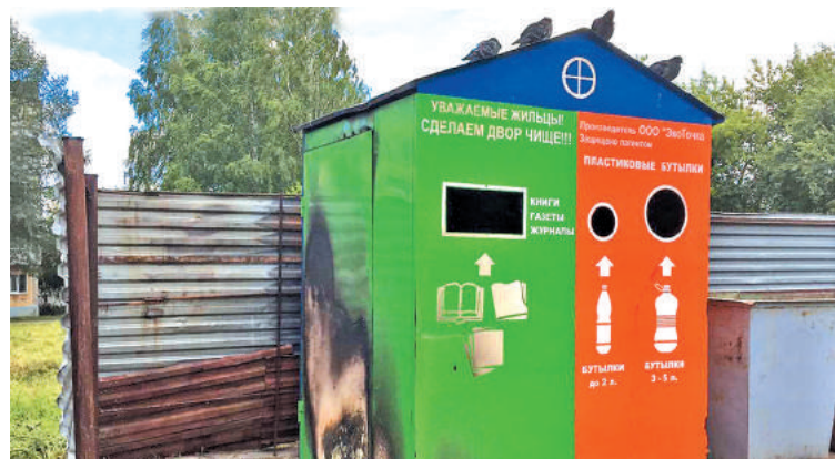
Экоточка контейнерной площадки во дворе дома № 12 по улице Ленина не в первый раз подвергается нападению вандалов.

Уважаемые жители! При выявлении подобных фактов и случаев складирования мусора, не относящегося к категории твёрдых коммунальных отходов, в местах временного хранения на мусорных контейнерных площадках внутридворовых территорий, местах общего пользования, что является нарушением закона, – просьба фиксировать их посредством фото или видеосъёмки. Материалы (обращение с приложением фотоматериалов и фиксации даты и места факта правонарушения, гос. номера транспортного средства или иных данных, позволяющих идентифицировать правонарушителя) направлять для реагирования в адрес регионального оператора ООО «Компания «Рифей» (622001, Свердловская область, г. Нижний Тагил, Черноисточинский тракт, д. 14, e-mail: rifeu-aro@mail.ru, тел. «горячей линии»: 8-800-234-02-43.