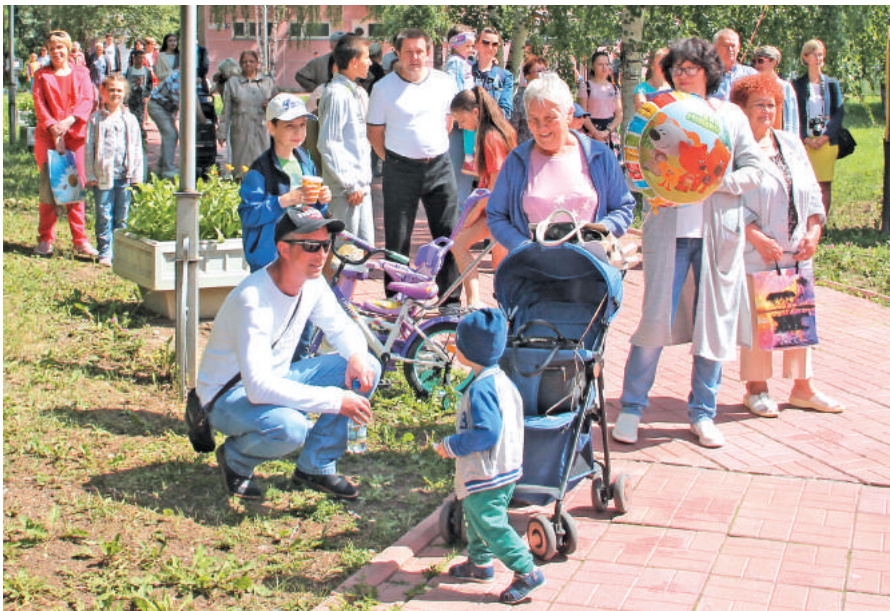
Праздник Дня семьи, любви и верности получился столь душевным, что даже после его окончания люди не стремились расходиться.