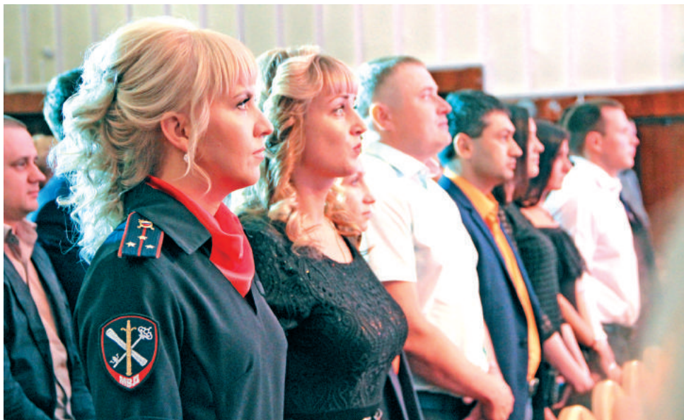
Минута молчания в память о коллегах, погибших при исполнении служебных обязанностей.

70 лет – целая история. Столько всего произошло за эти годы: менялось время, менялись люди... Но неизменным у сотрудников Отдела внутренних дел оставалось чувство высокой ответственности за покой и безопасность граждан. Отдел славится своими успехами, достижениями, традициями, которые передаются от поколения к поколению и сохраняются как главная ценность коллектива. Сегодня Отдел МВД Лесного – это слаженная, чётко действующая профессиональная команда.