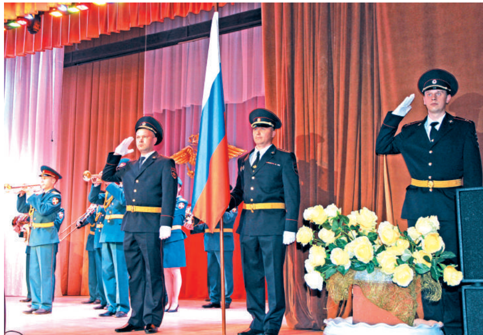
Торжественное собрание в честь 70-летия со дня образования ОМВД в Лесном началось с гимна Российской Федерации.

публику положительными эмоциями, удачно подобранным репертуаром и прекрасным исполнением порадовали зрителей талантливые творческие коллективы ОМВД. Самым трогательным моментом праздничного концерта стал вальс пап и их маленьких дочек. Руководители под-