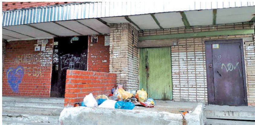
Площадка возле камеры мусоропровода в доме № 55 по улице Мамина-Сибиряка