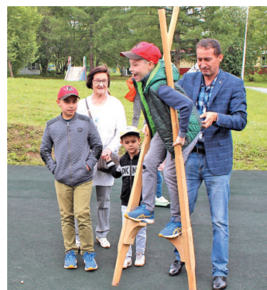
Организаторы праздника позаботились и о детях – для них была выделена большая зона конкурсов и состязаний.