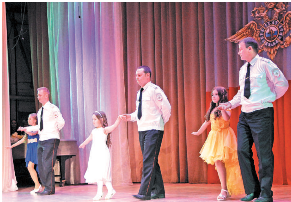
Самым трогательным моментом праздничного концерта стал вальс пап и их маленьких дочек.

Большой концерт стал хорошим подарком сотрудникам ОМВД в этот день. Настоящее шоу от войскового оркестра в/ч 3275 зарядило