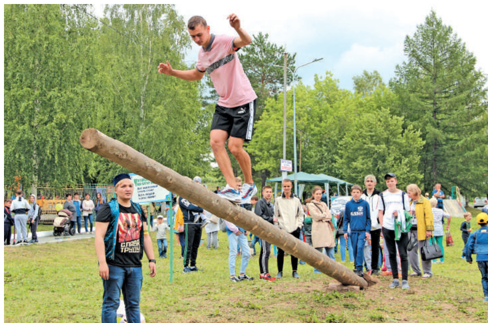
Не шатаемся! Идём ровно! Вершина близко!