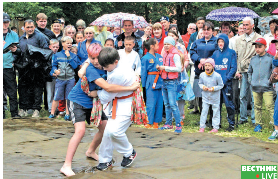
Борьба куреш. Жёсткое противостояние борцов, где учитывался любой неправильный захват, держало зрителей в напряжении.