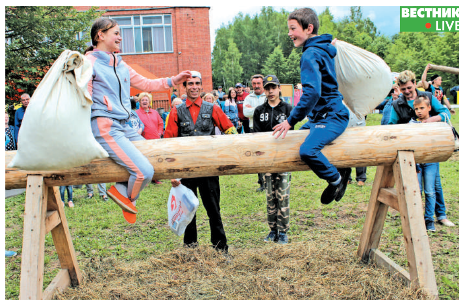
Кто сумеет дольше удержаться на бревне? Крик в помощь!