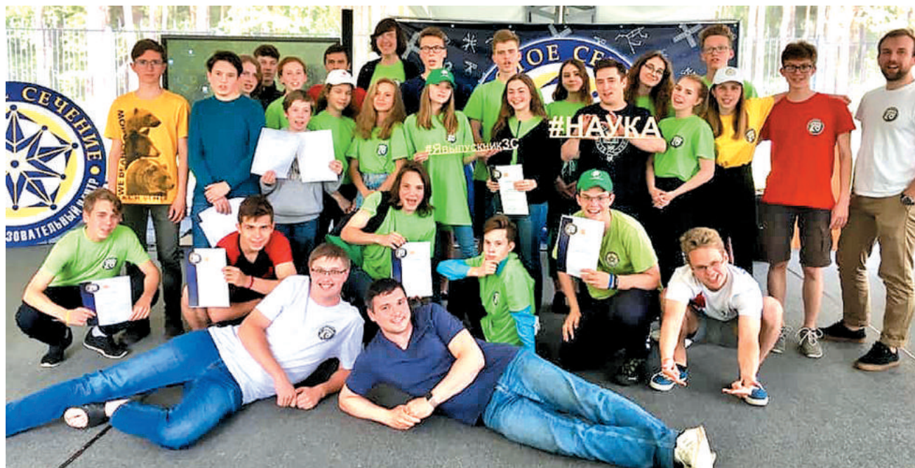
Ребята и преподаватели, которые приезжают на смену «Золотого сечения» - талантливы, открыты не только для развития в своих сферах, но и для общения друг с другом.