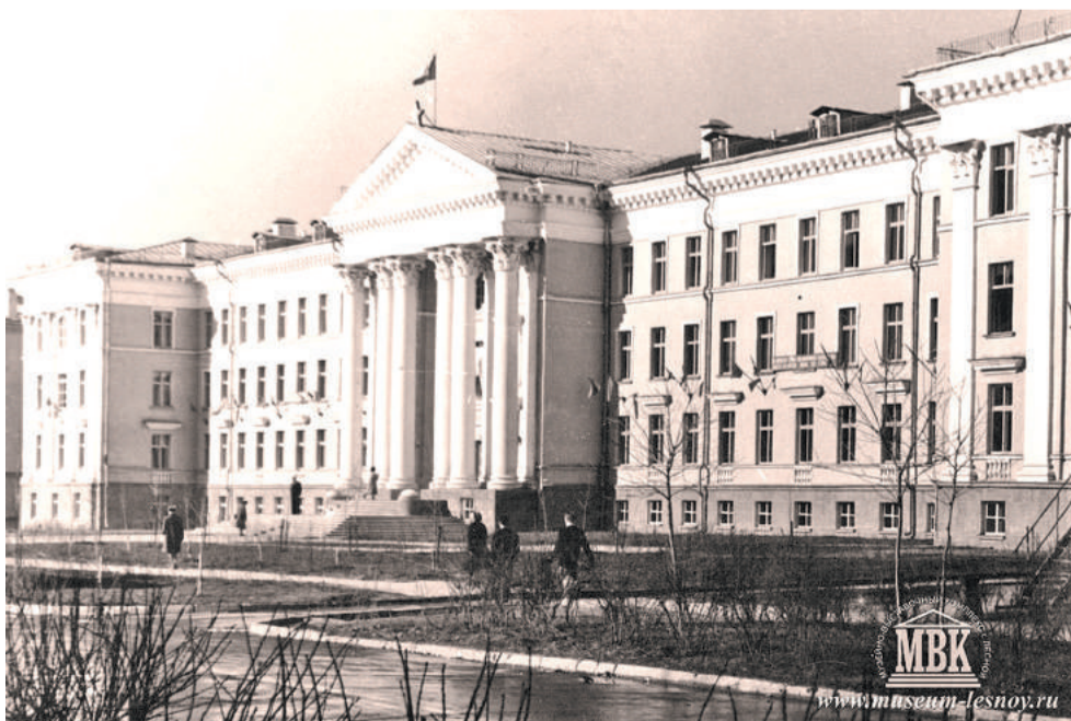
Здание института, 1959 год.

Александра ГРИШУК. ФОТОГРАФИИ ИЗ ФОНДОВ МУЗЕЯ.