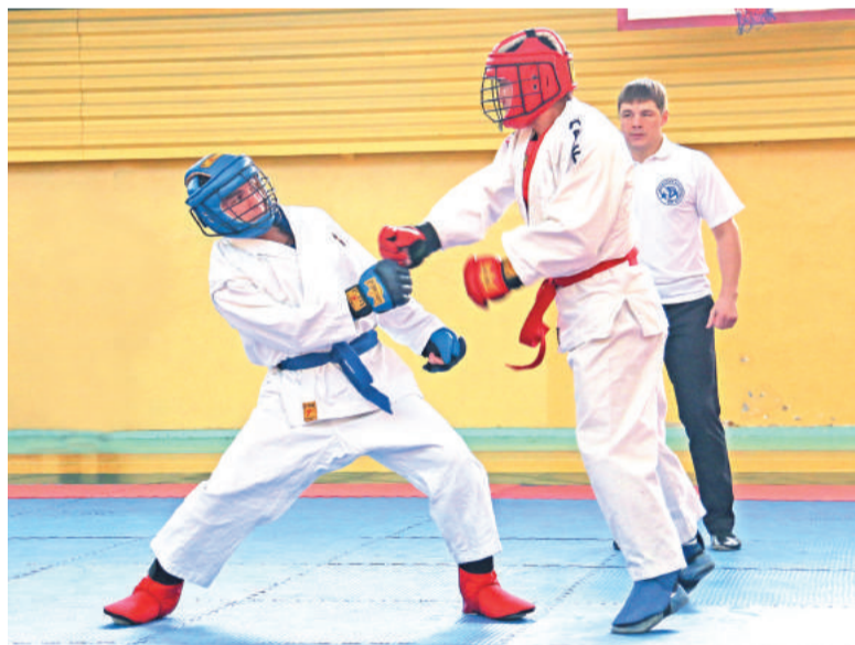
В нокаут – одним ударом.