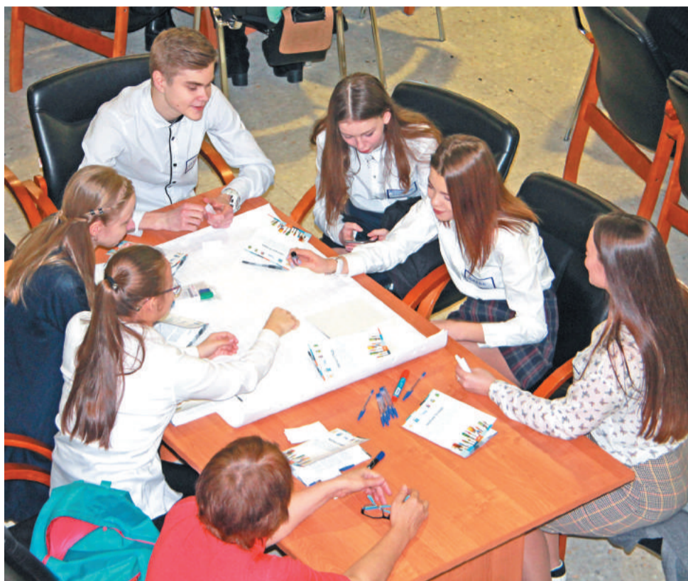
В ходе мозгового штурма «Креатив-сессии» у команд лесничан родилось много достойных идей.

В поисках идей для социального предпринимательства лесничане устроили мозговой штурм