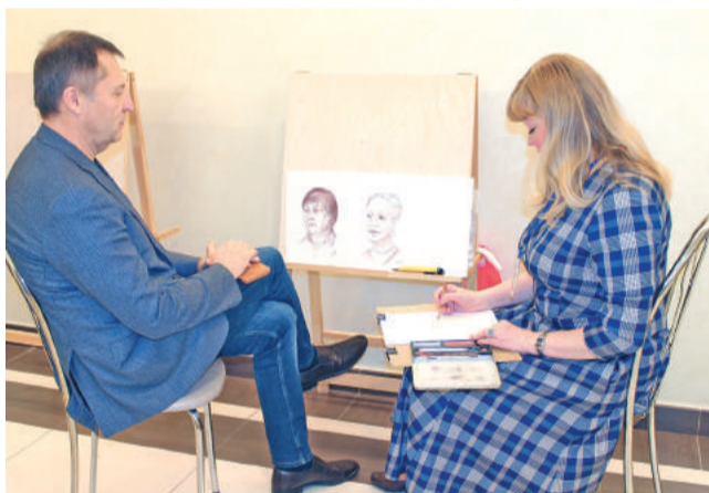
Зрители стали также участниками мастер-классов от преподавателей ДШИ Лесного.