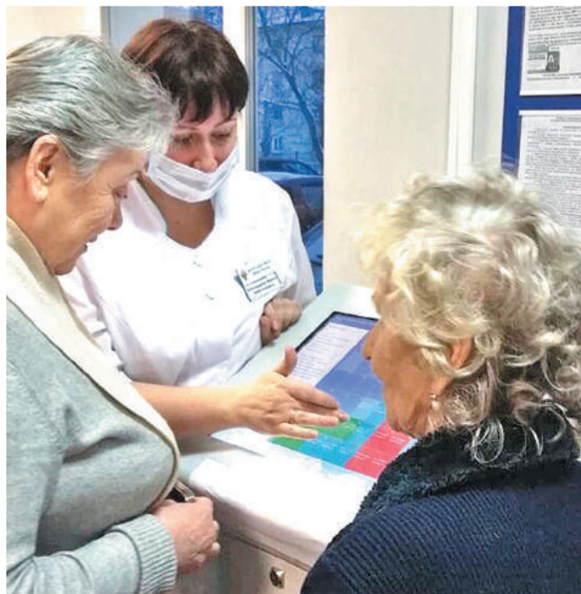
Сотрудники регистратуры оказывают пациентам необходимую помощь при работе с устройством.