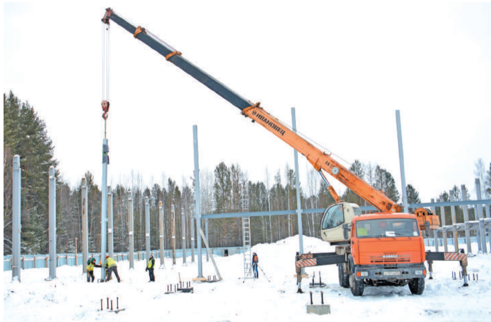
График работ согласован. К концу 2019 года объект будет достроен.

– Сегодня у нас важное событие на объекте строительства спортивной школы с искусственным льдом. В конце 2018