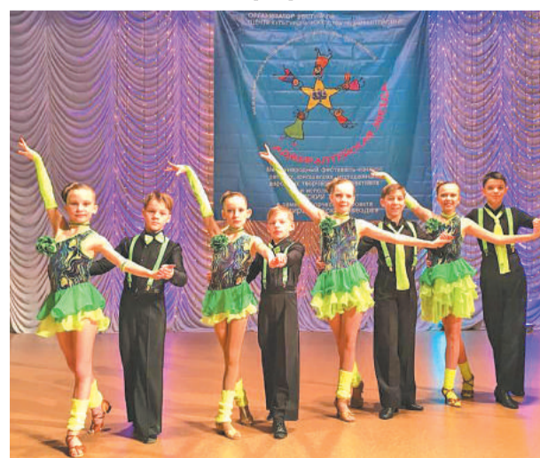
Блистательное «Созвездие» из Лесного.

Подготовила Татьяна БЕКЕТОВА.