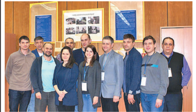
Эксперты – представители разных предприятий, в том числе ТИ НИЯУ МИФИ и ФГУП ЭХП.

На конференции эксперты подвели итоги прошедшего чемпионата «AtomSkills-2018», рассмотрели новые направления развития компетенции, уточнили модули, входящие в конкурсное задание, инфраструктурные листы, рассмотрели план застройки компетенции на площадке. Были распределены роли между экспертами на площадке во время проведения чемпионата, утверждены главные эксперты, заместители главного эксперта и технический эксперт.