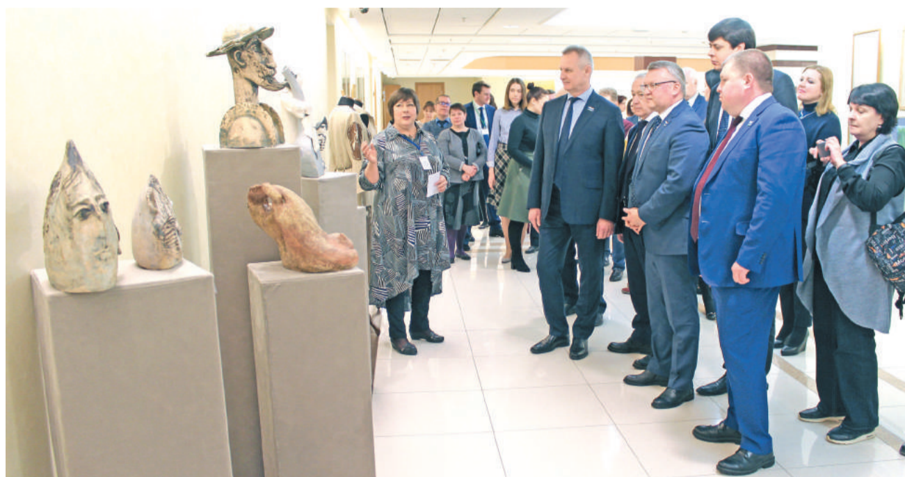
Во время открытия экспозиции высокими гостями была подчеркнута уникальность нашего города, который является кладом талантов.

Все они отметили уникальность нашего города, который является настоящим кладом талантов, удивительное мастерство юных художников, профессионализм и энтузиазм педагогов ДШИ, которые сумели заразить своих подопечных любовью к искусству. В открытии выставки принял участие и глава