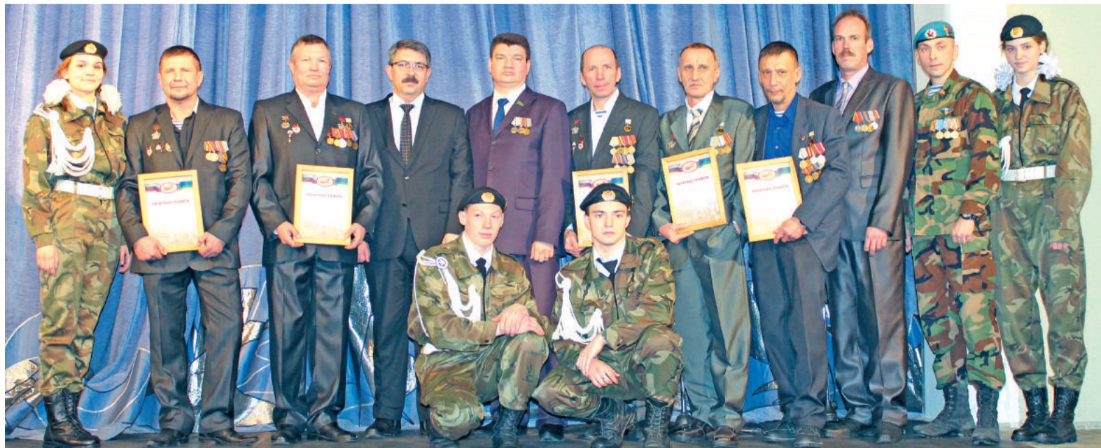
Представители делегации из Лесного.

В Лесном городское торжественное мероприятие, посвящённое памятной дате, состоится 15 февраля. Ветеранам-«афганцам» и родственникам погибших бойцов будут вручены медали «30 лет вывода советских войск из Афганистана».