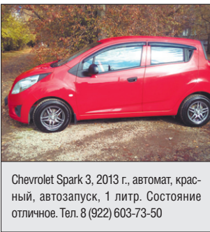
Chevrolet Spark 3, 2013 г., автомат, красный, автозапуск, 1 литр. Состояние отличное. Тел. 8 (922) 603-73-50

■ Daewoo Matiz, 05 г.в., цвет серебристый. Цена договорная. Тел. 8 (900) 209-90-95