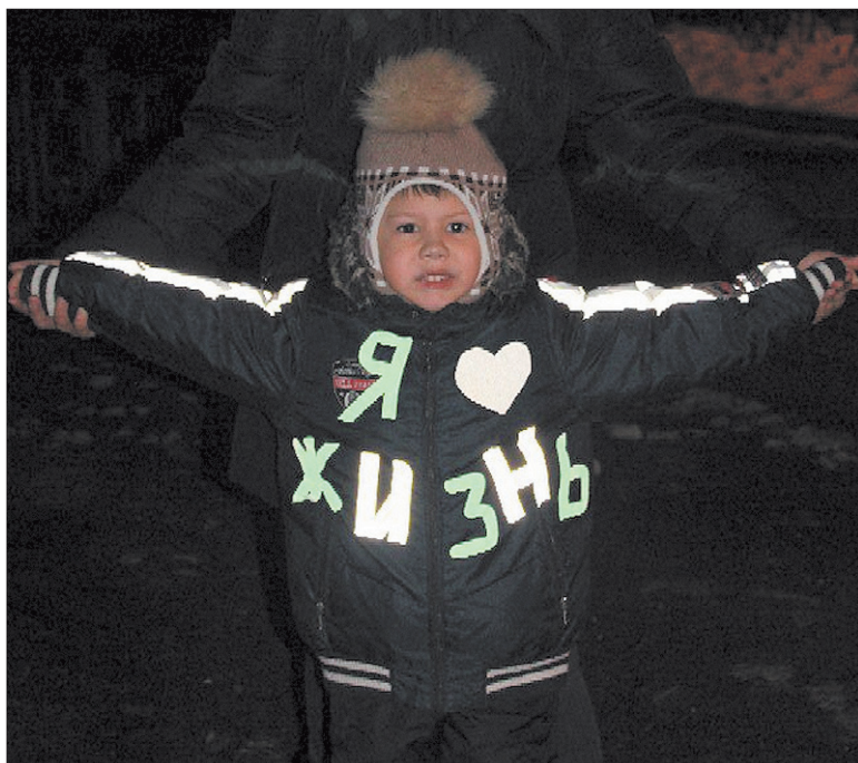
В конце прошлого года ревдинское отделение ГИБДД предложило жителям Ревды и Дегтярска поучаствовать в конкурсе на лучший костюм со световозвращателями. Откликнулось полсотни человек.

Водитель, не забывший надеть световозвращающий жилет, сможет спасти себе жизнь в случае