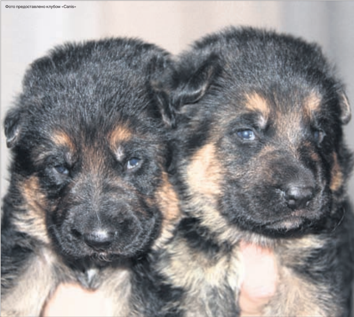
Хороший щенок немецкой овчарки в среднем стоит 15000 рублей.

— Щенок должен быть активный, веселый, — говорит Анастасия Пушкина. — Он не должен от вас убегать, бояться. Щенки овчарки все легко идут на контакт. Они