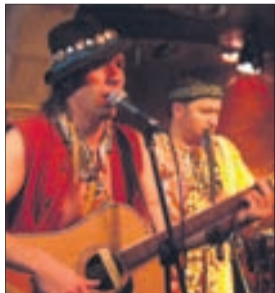
группа «Здоб Ши Здуб»