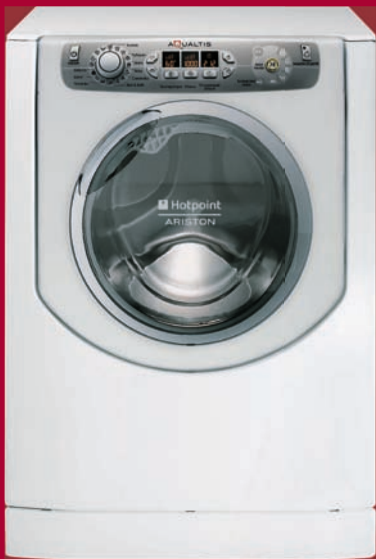
AQSF 05 I (CIS) L