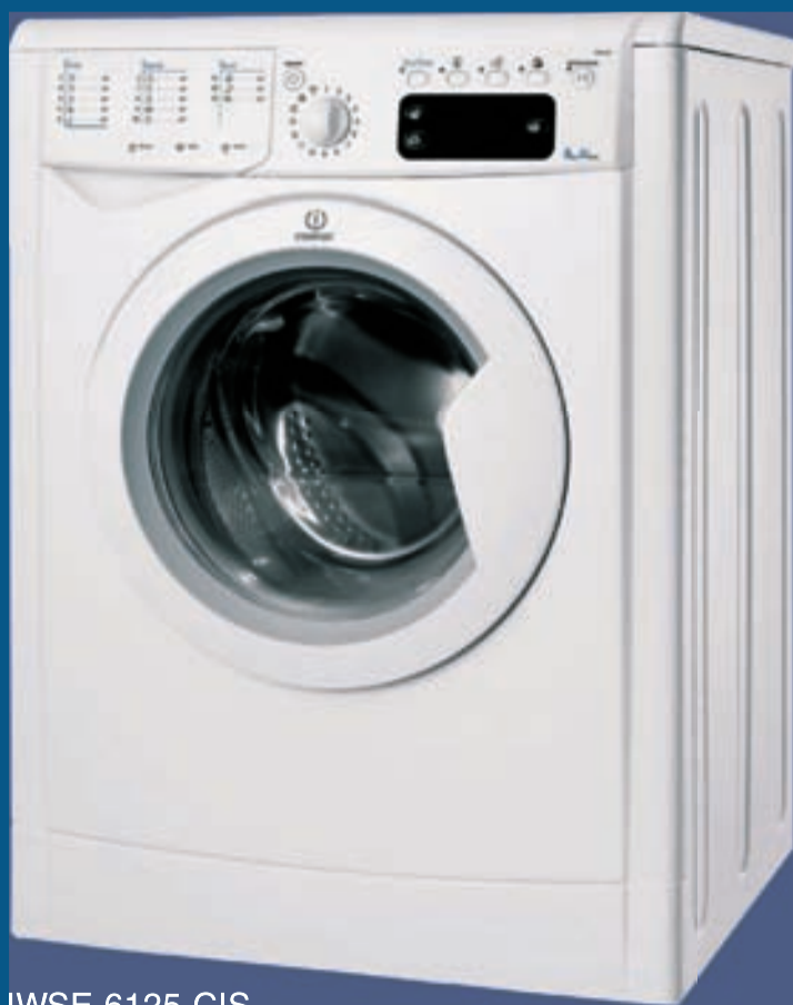
IWSE 6125 CIS