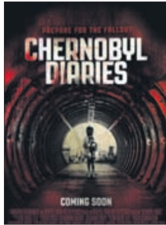
ЗАПРЕТНАЯ ЗОНА Ужасы, триллер