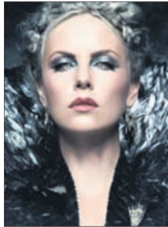
БЕЛОСНЕЖКА И ОХОТНИК Фэнтезийный боевик