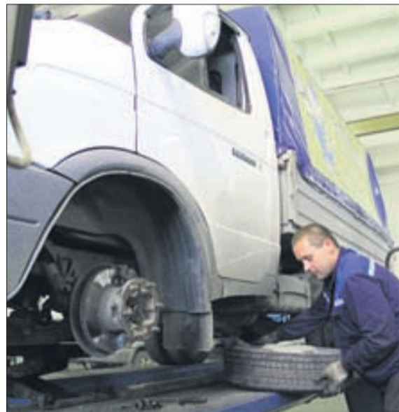
В «Юмаксе» оказывается полный спектр услуг по ремонту автомобилей.

«Юмакс» такой ответственности не боится.