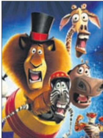
МАДАГАСКАР 3 Мультфильм