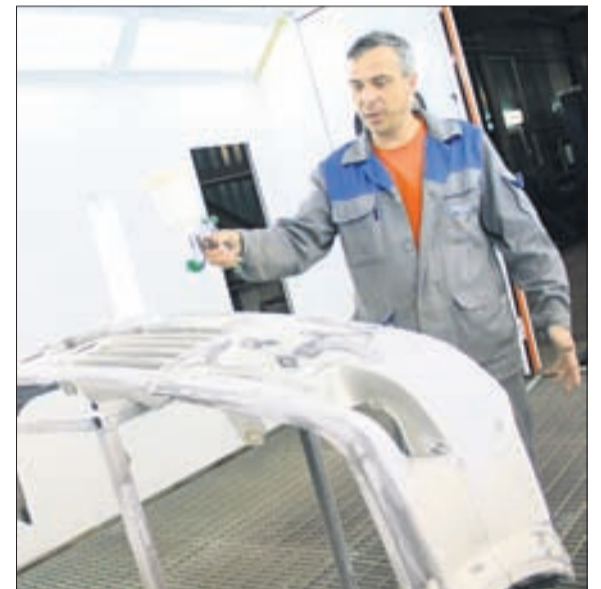
Одно из преимуществ автосервиса «Юмакс» — современная окрасочная камера.