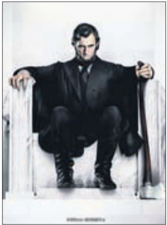
ПРЕЗИДЕНТ ЛИНКОЛЬН Фантастика