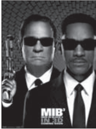
ЛЮДИ В ЧЕРНОМ - 3 Фантастический боевик