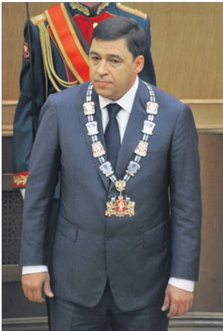
ЕВГЕНИЙ КУЙВАШЕВ родился 16 марта 1971 года в поселке Луговой Ханты-Мансийского автономного округа.