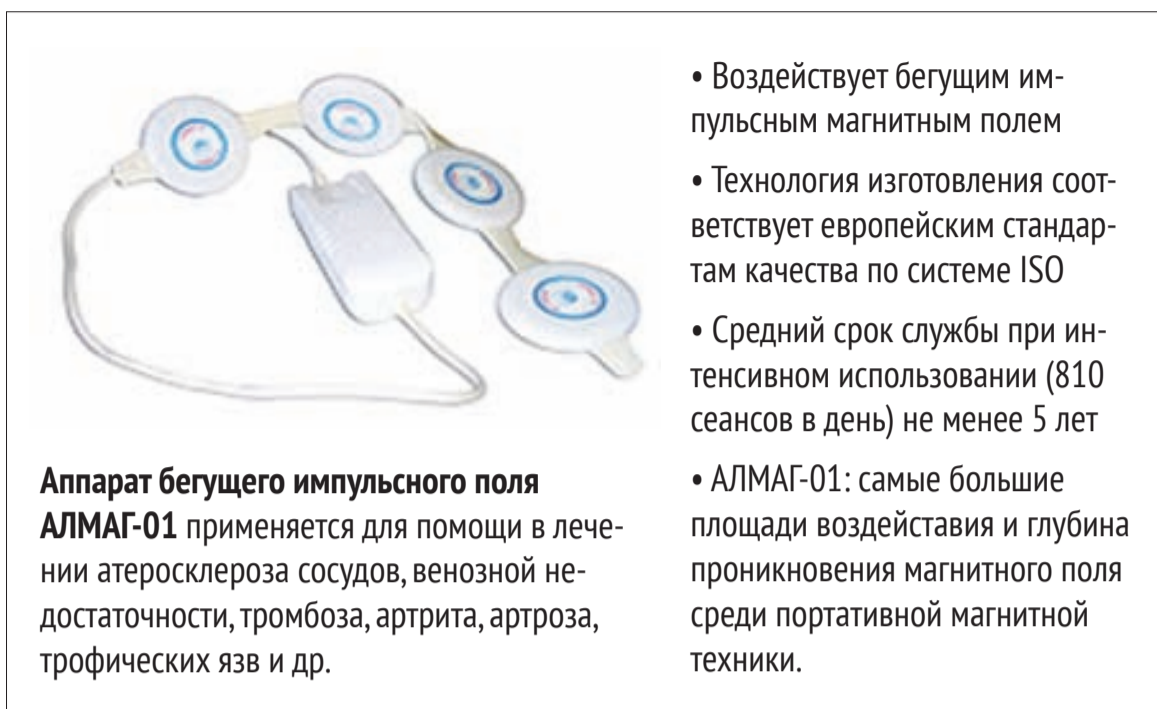
Аппарат бегущего импульсного поля АЛМАГ-01 применяется для помощи в лечении атеросклероза сосудов, венозной недостаточности, тромбоза, артрита, артроза, трофических язв и др.

АЛМАГ-01 – аппарат для помощи в лечении бегущим импульсным магнитным полем. Вот основные показани-