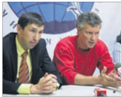
Пресс-конференция Фонда «Первоуральск — Город без наркотиков»