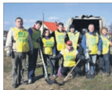
Общественная организация «Все вместе» на субботнике