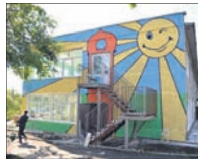
Первый лицензированный частный детский сад в Первоуральске