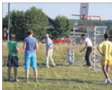
Новое футбольное поле на Пильной