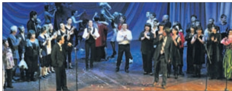
Юбилей первоуральского театра Драмы и комедии.