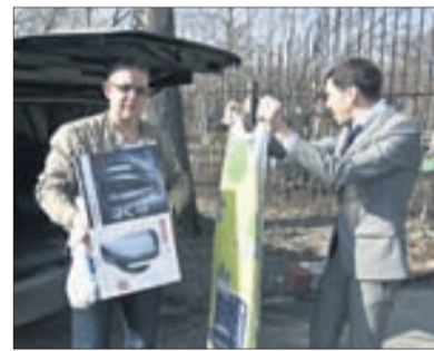
Благотворительная поддержка Дома малютки