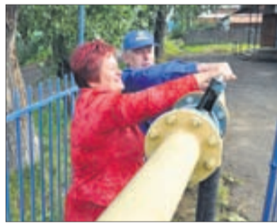
Запуск газа в поселке Самстрой

Благотворительная помощь ветеранским организациям и детским учреждениям, занимающимся воспитанием и образованием детей, оставшихся без заботы родителей.