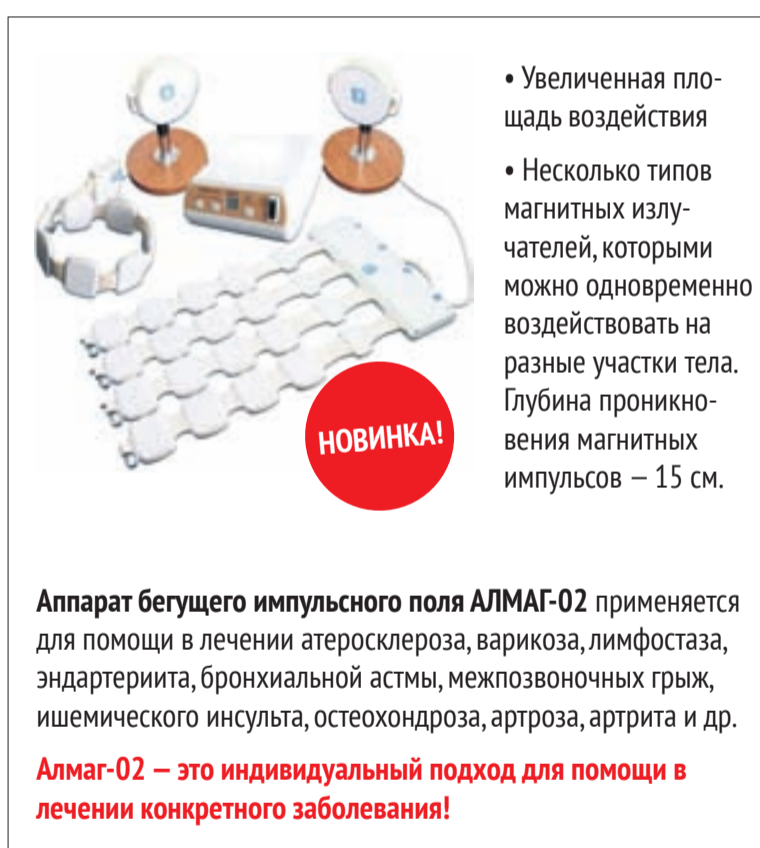
Аппарат бегущего импульсного поля АЛМАГ-02 применяется для помощи в лечении атеросклероза, варикоза, лимфостаза, эндартериита, бронхиальной астмы, межпозвоночных грыж, ишемического инсульта, остеохондроза, артроза, артрита и др.

Настоящим специалистом для помощи в лечении варикозной болезни является АЛМАГ-02 – истинный профессионал с «мозгами» и «мускулами»! Мускулы АЛМАГа-02 – это его излучатели, которые существенно