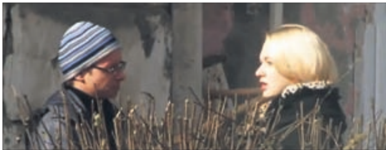
Кадр из сюжета «Интерна-ТВ»

АНАСТАСИЯ ПОНОМАРЁВА, ap@gorodskiestvesti.ru