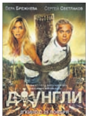
ДЖУНГЛИ Комедия (14+)