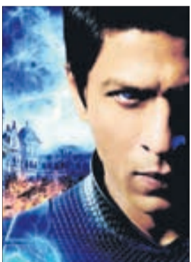
СЛУЧАЙНЫЙ ДОСТУП Фантастика (12+)