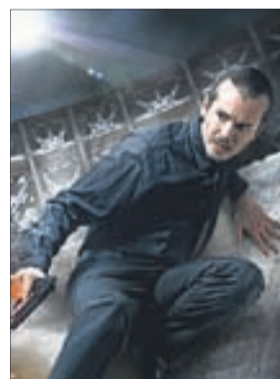
БРИГАДА: НАСЛЕДНИК Боевик (16+)