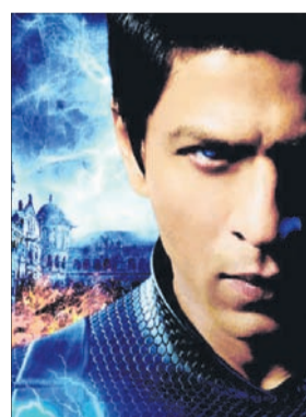
СЛУЧАЙНЫЙ ДОСТУП Фантастика (12+)