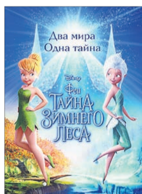
ФЕИ: ТАЙНА ЗИМНЕГО ЛЕСА Мультфильм (0+)