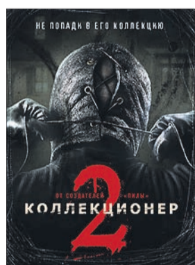
КОЛЛЕКЦИОНЕР 2 Ужасы (18+)