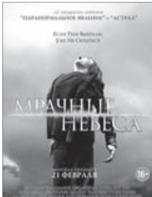
МРАЧНЫЕ НЕБЕСА Ужасы, фантастика (18+)