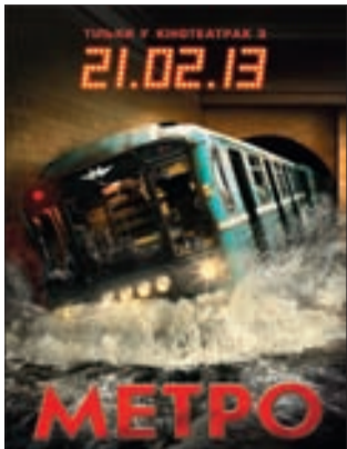
МЕТРО Триллер (16+)