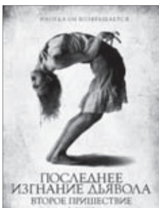
ПОСЛЕДНЕЕ ИЗГНАНИЕ ДЬЯВОЛА-2 Ужасы, фантастика (18+)