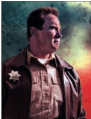
ВОЗВРАЩЕНИЕ ГЕРОЯ Боевик (16+)