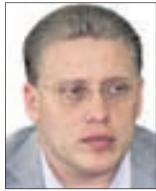
ЮРИЙ ПЕРЕВЕРЗЕВ , мэр

Почему я отклонил решение? Потому что не была должным образом осуществлена публикация всех изменений в устав города. Если публикация была осуществлена ненадлежащим образом, значит и решение думы не имеет юридической силы.