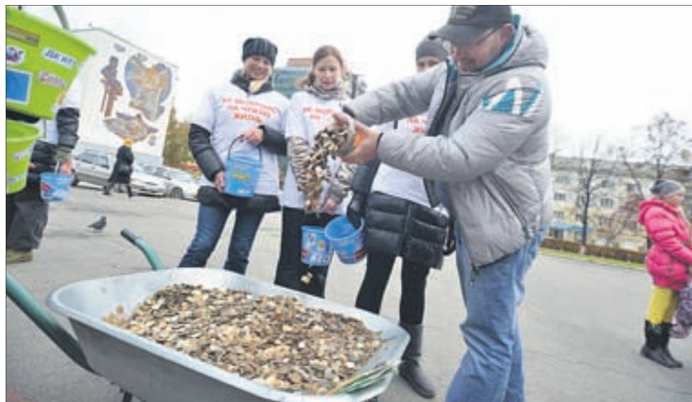
Музыку на площади непрерывно заглушал громкий звон падающих монет.

цию, организовали родителей и сделали доброе дело.