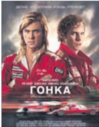
ГОНКА Боевик, драма, спорт (16+)