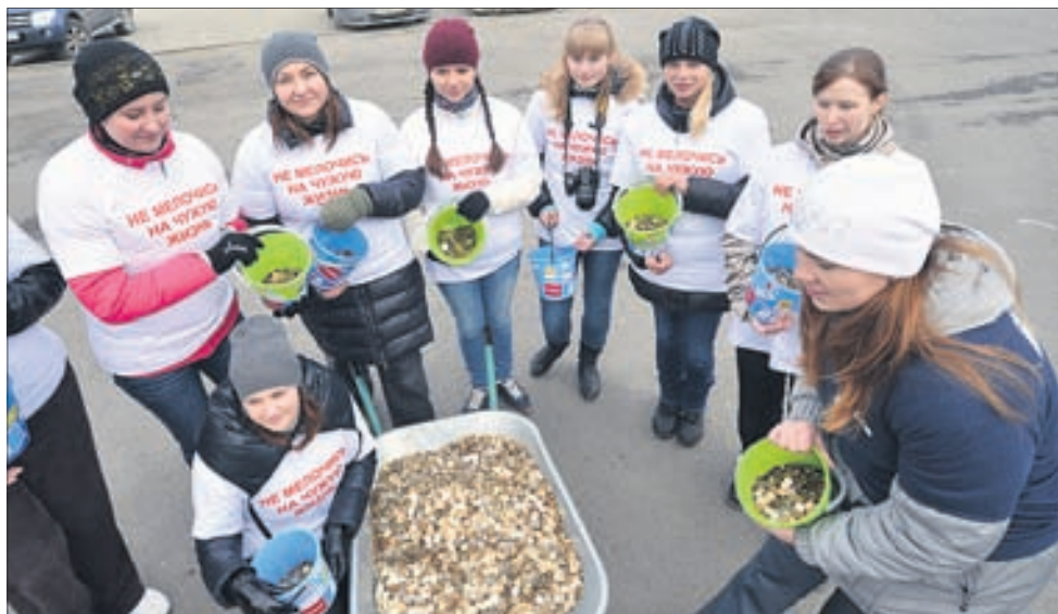
Работа по сортировке денег легла на плечи журналистов.