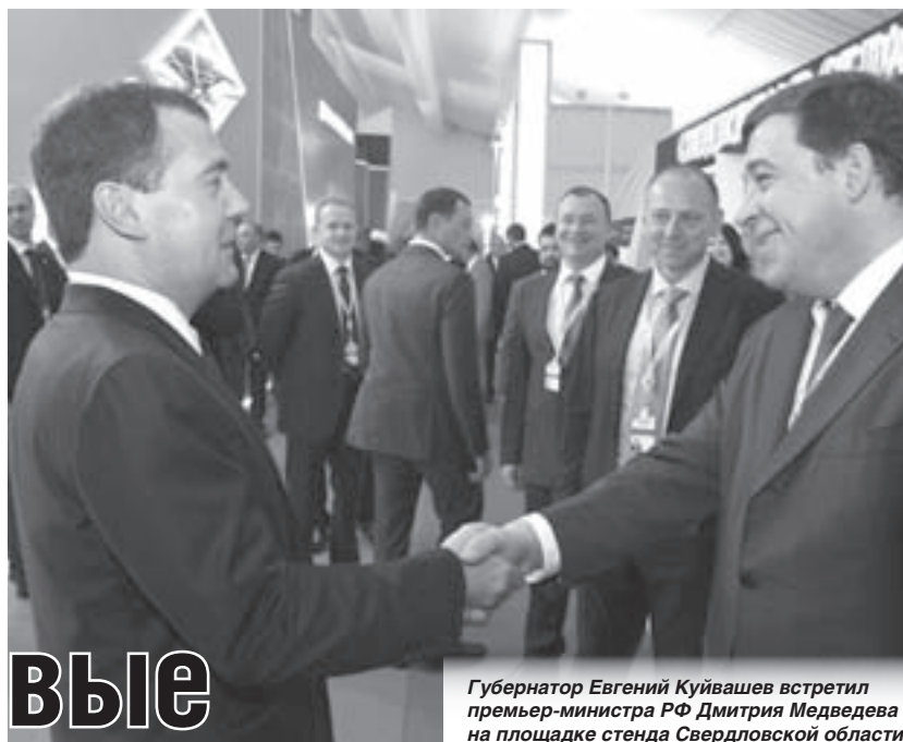
Губернатор Евгений Куйвашев встретил премьер-министра РФ Дмитрия Медведева на площадке стенда Свердловской области.

26-27 сентября губернатор Евгений Куйвашев возглавил делегацию Свердловской области, презентовавшую программы и проекты региона на XII Международном инвестиционном форуме «Сочи-2013».