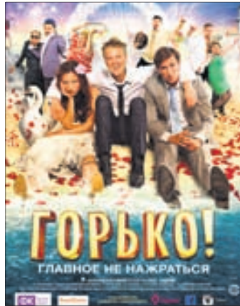
ГОРЬКО! Комедия, приключения (12+)