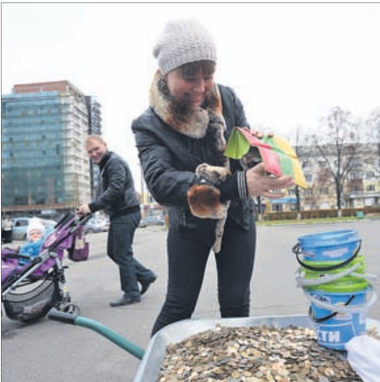
Помогали не только люди, которые целенаправленно приходил на акцию, но и просто прохожие, которые случайно оказались в нужном месте в нужное время.