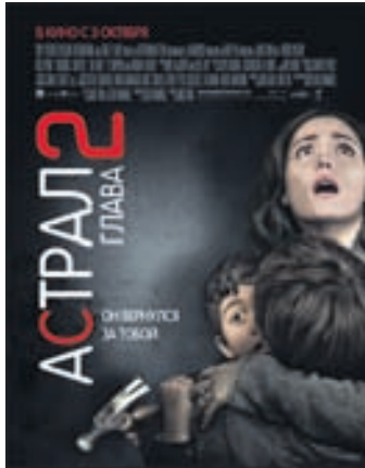
АСТРАЛ: ГЛАВА 2 Триллер (16+)