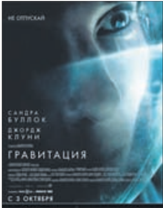
ГРАВИТАЦИЯ В 3D Фантастика (12+)