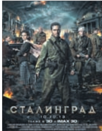
СТАЛИНГРАД Военный, драма, история (12+)