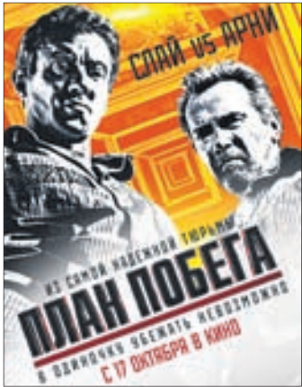
ПЛАН ПОБЕГА Боевик (16+)