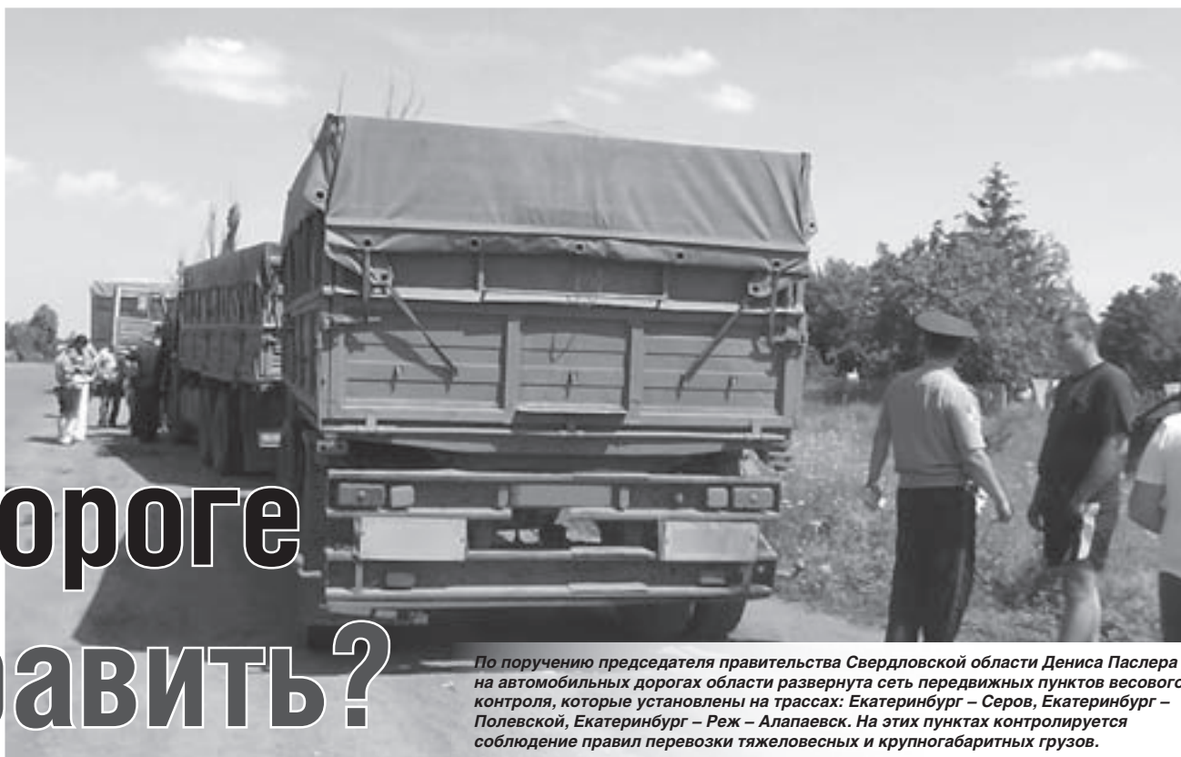
По поручению председателя правительства Свердловской области Дениса Паслера на автомобильных дорогах области развернута сеть передвижных пунктов весового контроля, которые установлены на трассах: Екатеринбург – Серов, Екатеринбург – Полевской, Екатеринбург – Реж – Алапаевск. На этих пунктах контролируется соблюдение правил перевозки тяжеловесных и крупногабаритных грузов.

Перевозить грузы промышленных предприятий предлагается не на автомобильном, а на железнодорожном транспорте. Такое предложение в этом году озвучило региональное министерство транспорта и связи. Это обосновано влиянием тяжёлых машин на дорожное полотно. Весной и летом на автомобильных дорогах Свердловской области традиционно на месяц устанавливают временное ограничение движения тяжеловесного транспорта, чтобы сохранить от разрушения дорожное покрытие. Вынужденная мера в первую очередь касается компаний-грузоотправителей и перевозчиков.