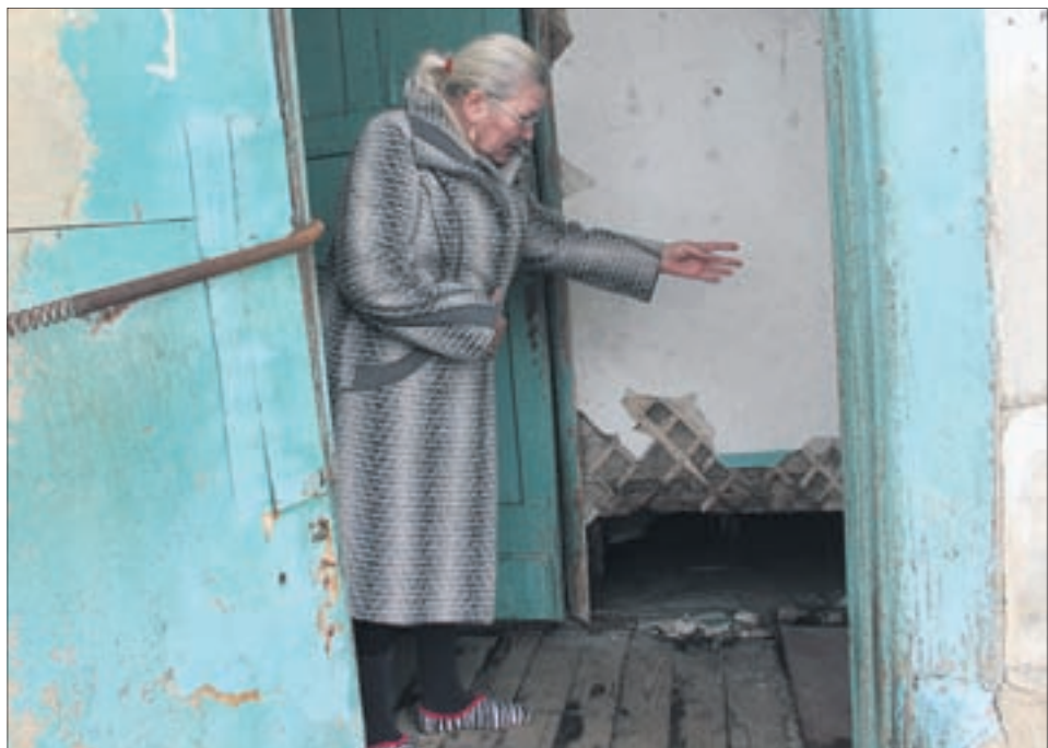
Цветочная, 5 рассыпается на глазах жильцов. Люди ждут переселения, но их мечтам пока никак не суждено сбыться.

Напиши СМС главе администрации Первоуральска Алексею Дронову 8-902-27-66-111