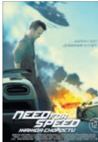
NEED FOR SPEED: ЖАЖДА СКОРОСТИ В 3D Боевик (12+)