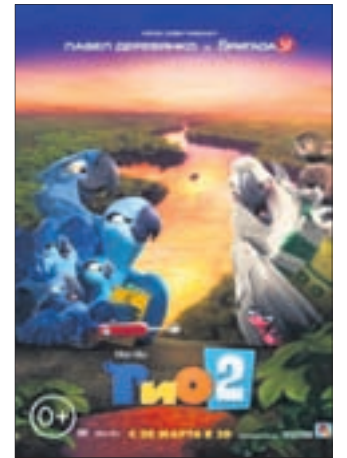
РИО 2 В 3D Комедия (0+)