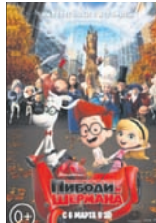
ПРИКЛЮЧЕНИЯ МИСТЕРА ПИБОДИ И ШЕРМАНА Комедия (0+)