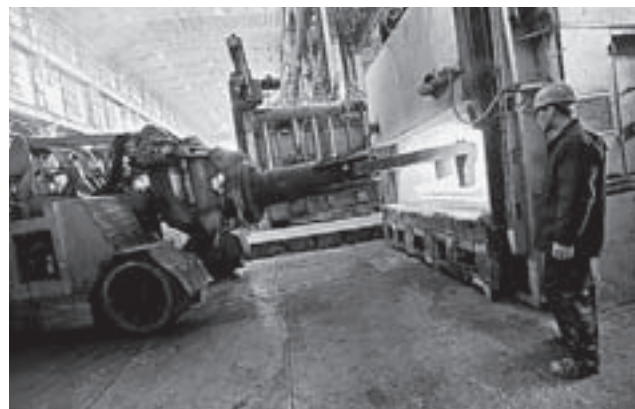
■ По материалам пресс-службы Законодательного Собрания Свердловской области

Руководству ОЭЗ парламентарии рекомендовали продолжить работу по привлечению резидентов и инвесторов, а правительству области - обеспечить выделение бюджетных инвестиций ОАО «Особая экономическая зона «Титановая долина» в объёмах, предусмотренных областным бюджетом: в 2014 году – 841 млн. рублей, в 2015 году – 946,6 миллионов, в 2016 году – 1,25 млрд. рублей.