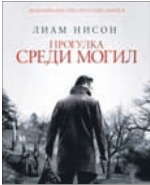
ПРОГУЛКА СРЕДИ МОГИЛ Детектив (16+)