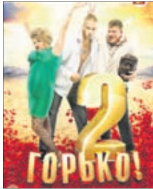
ГОРЬКО! 2 Комедия (16+)