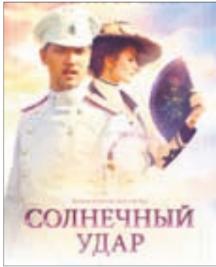
СОЛНЕЧНЫЙ УДАР Драма (12+)