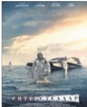
ИНТЕРСТЕЛЛАР Фантастика (12+)