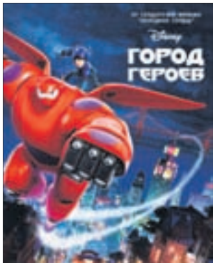
ГОРОД ГЕРОЕВ 3D Мультфильм (6+)