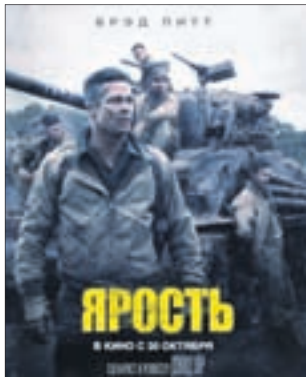
ЯРОСТЬ Боевик (16+)