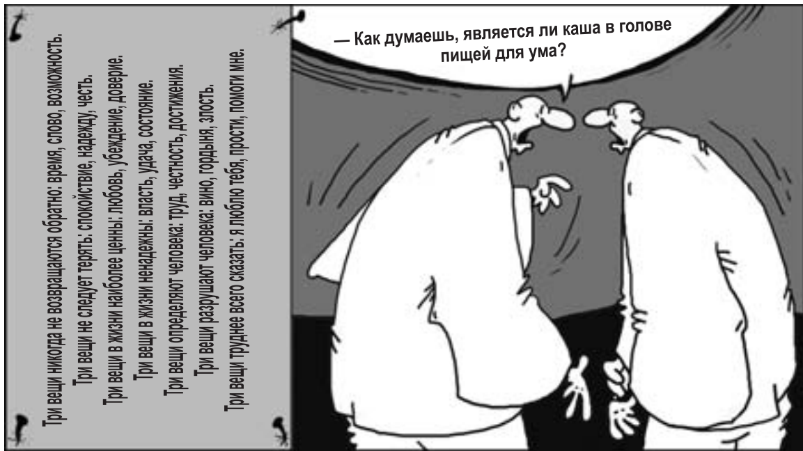
Афоризм от Юрия Шарова