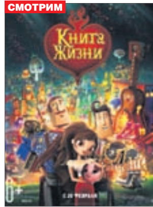
КНИГА ЖИЗНИ Мультфильм (6+)

«Восход» (т. 66-74-45) «Сфера Синема» (т. 29-79-50)