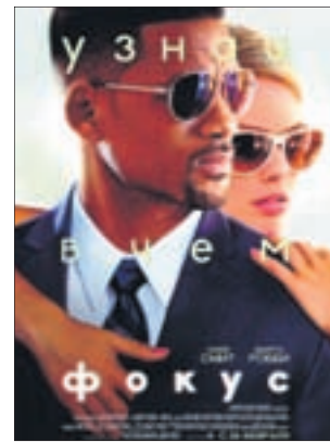
ФОКУС Комедия (18+)