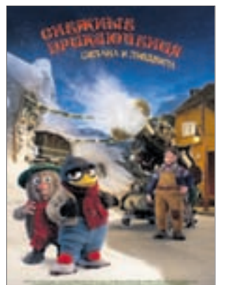
СНЕЖНЫЕ ПРИКЛЮЧЕ- НИЯ СОЛАНА И ЛЮДВИГА Мультфильм (0+)