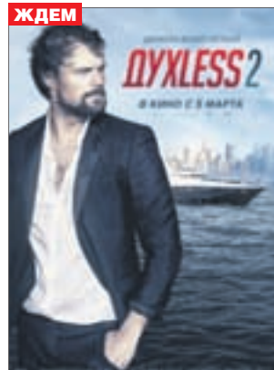
ДУХLESS 2 Драма (16+)