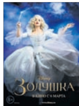
ЗОЛУШКА Фэнтези (6+)