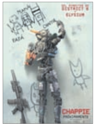
РОБОТ ПО ИМЕНИ ЧАППИ Боевик (16+)