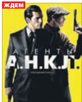
АГЕНТЫ А.Н.К.Л. Боевик (12+)