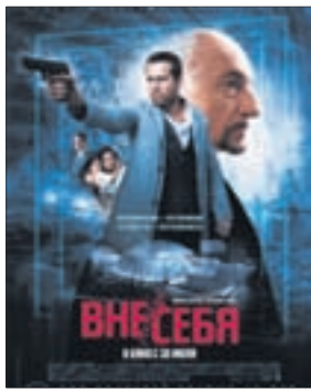
ВНЕ СЕБЯ Фантастика (16+)