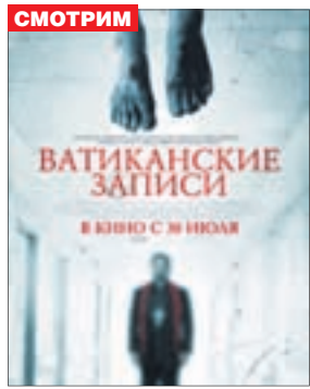
ВАТИКАНСКИЕ ЗАПИСИ Ужасы (18+)

«Восход» (т. 66-74-45) «Сфера Синема» (т. 29-79-50)