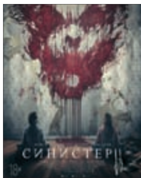
СИНИСТЕР 2 Ужасы (18+)