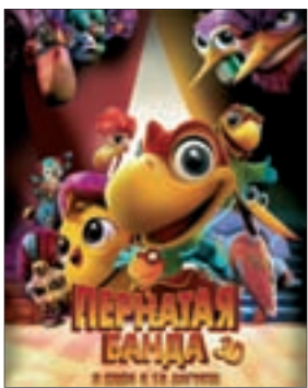
ПЕРНАТАЯ БАНДА Мультфильм (6+)