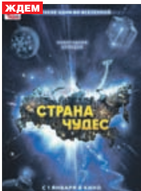
СТРАНА ЧУДЕС Комедия (12+)