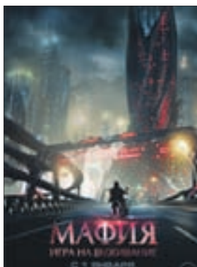
МАФИЯ: ИГРА НА ВЫЖИВАНИЕ Фантастика (12+)