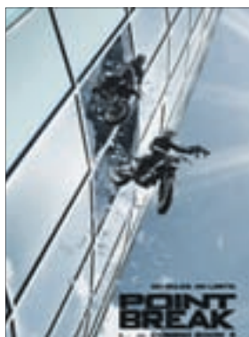
НА ГРЕБНЕ ВОЛНЫ Боевик (16+)