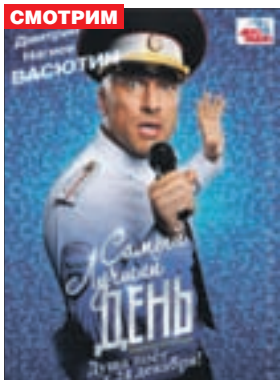
САМЫЙ ЛУЧШИЙ ДЕНЬ Комедия (6+)

«Восход» (т. 66-74-45) «Сфера Синема» (т. 29-79-50)