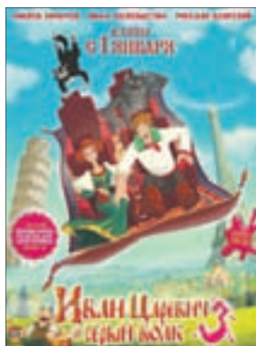
ИВАН ЦАРЕВИЧ И СЕРЫЙ ВОЛК 3 Мультфильм (6+)