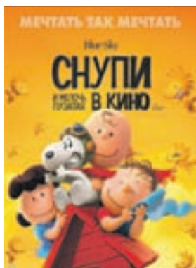
СНУПИ И МЕЛОЧЬ ПУЗАТАЯ В кино Мультфильм (0+)