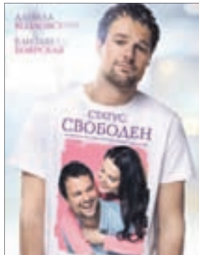
СТАТУС: СВОБОДЕН Комедия (16+)