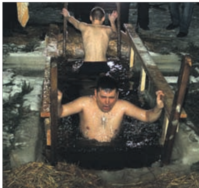
Сотни первоуральцев окунулись в иордань в крещенскую ночь.