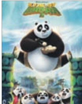
КУНГ-ФУ ПАНДА 3 Мультфильм (6+)