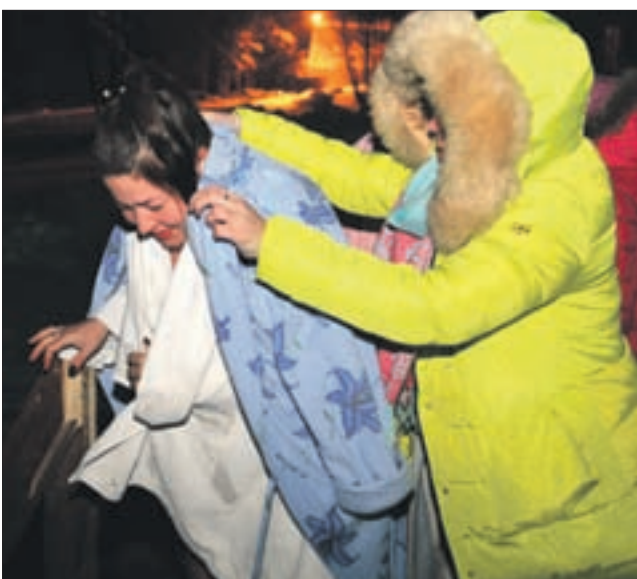
Купание напоминает конвейер: скинул одежду, окунулся — на выход, следующий.

— Да проблем что-то накопилось, смыть с себя все хочется, — проговаривает взрослые фразеологиз-