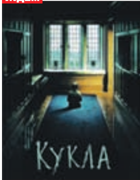
КУКЛА Ужасы (16+)