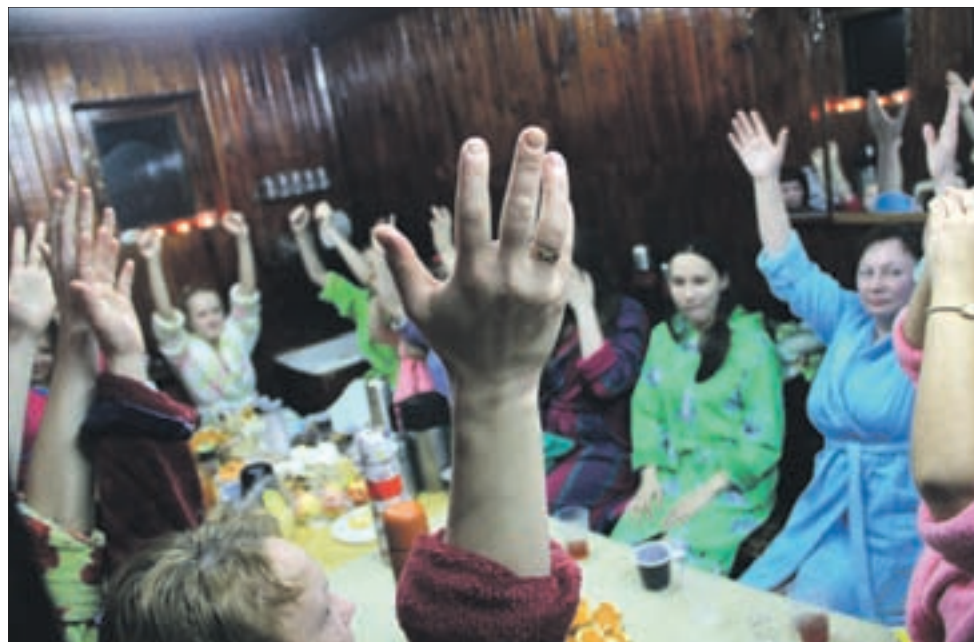
Девушки повторяли мантру, чтобы зарядиться энергией.