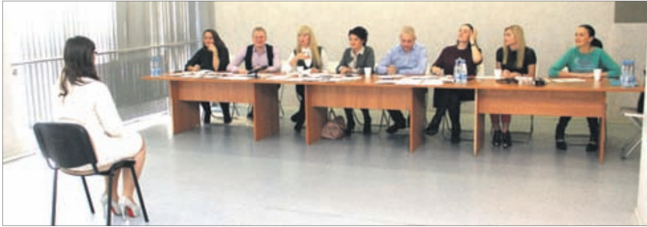
Среди членов жюри были организаторы, предприниматели, педагоги и финалистки конкурсов красоты.