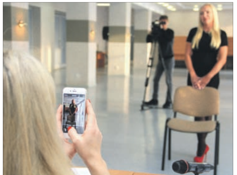
Многие конкурсантки читали стихи жюри.