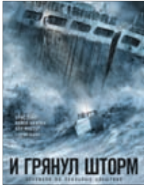
И ГРЯНУЛ ШТОРМ Боевик (12+)