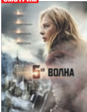
5-Я ВОЛНА Фантастика (12+)