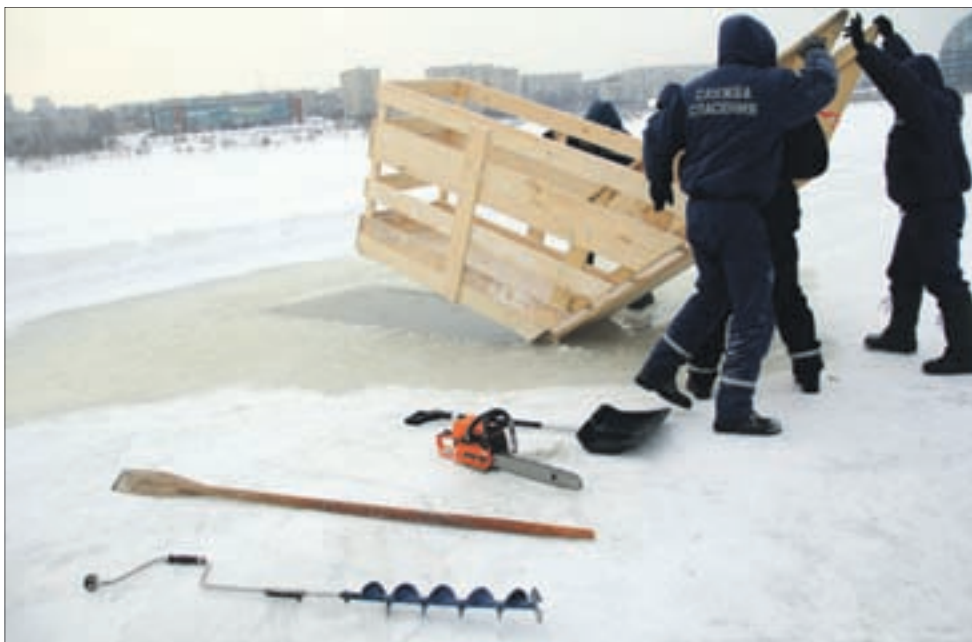
МЧСники начали готовиться к ночи крещения за несколько дней.