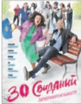
30 СВИДАНИЙ Комедия (16+)