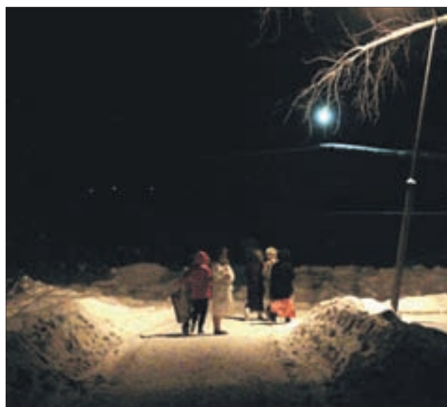
В расстегнутых сапогах, сланцах люди бегут по истоптанной дорожке в сторону пруда.