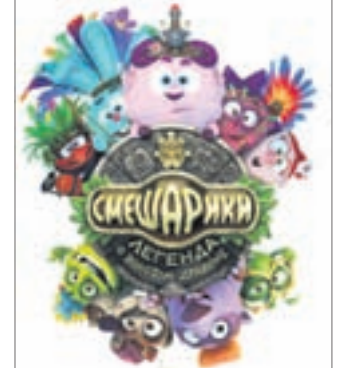
СМЕШАРИКИ. ЛЕГЕНДА О ЗОЛОТОМ ДРАКОНЕ Мультфильм (6+)