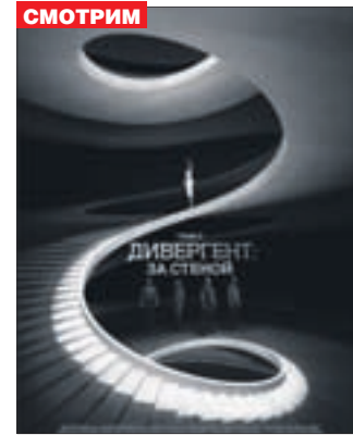
ДИВЕРГЕНТ, ГЛАВА 3: ЗА СТЕНОЙ Фантастика (12+)