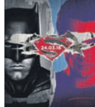
БЭТМЕН ПРОТИВ СУПЕРМЕНА: НА ЗАРЕ СПРАВЕДЛИВОСТИ Фантастика (12+)