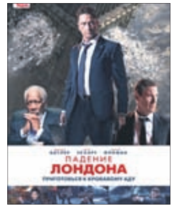
ПАДЕНИЕ ЛОНДОНА Боевик (16+)