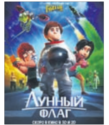
ЛУННЫЙ ФЛАГ Мультфильм (6+)