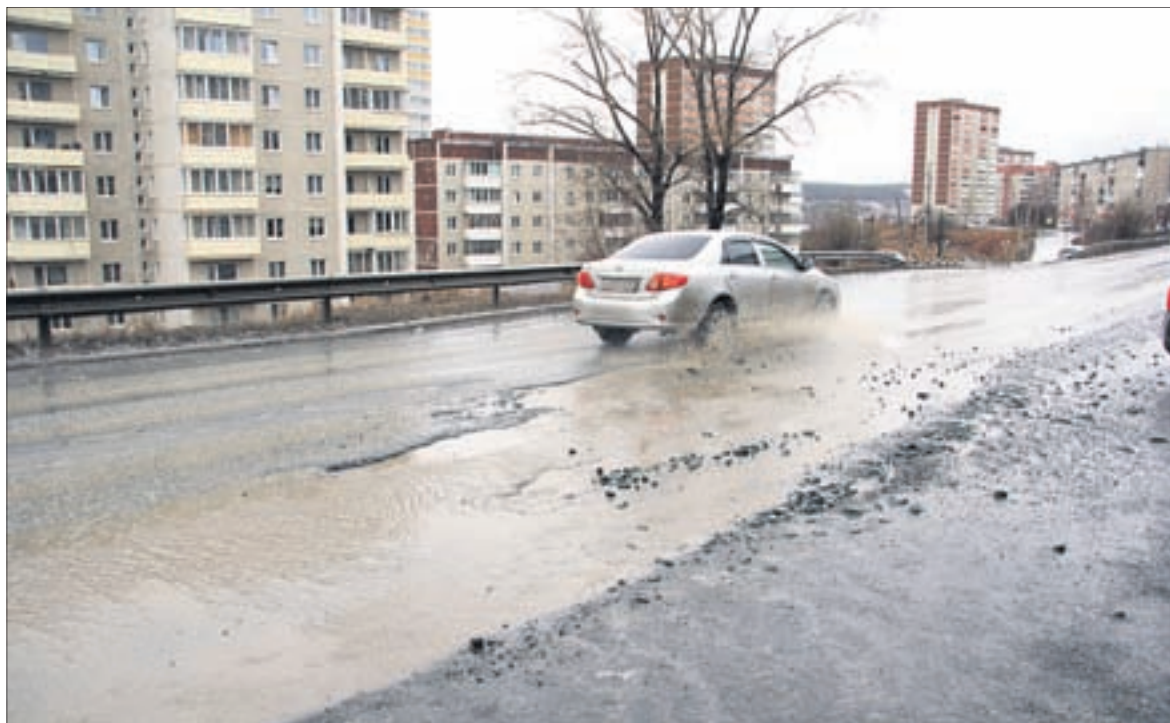
Улицу Емлина обещают подлатать в этом году. Где именно — пока точной информации нет.