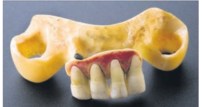
Протез, выполненный из зубов бегемота, Англия, 1795 г.