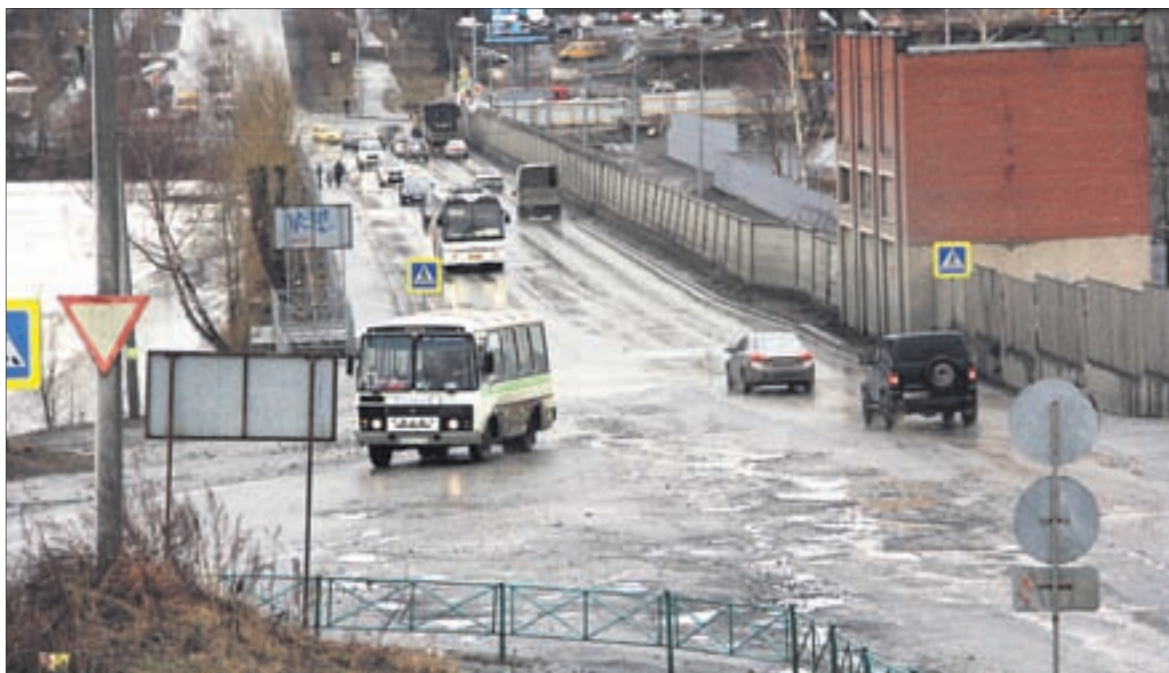
Ремонт ливневой канализации на Старотрубном — решение сразу комплекса проблем на этом участке.

— Архив погиб. Документы не сохранились.