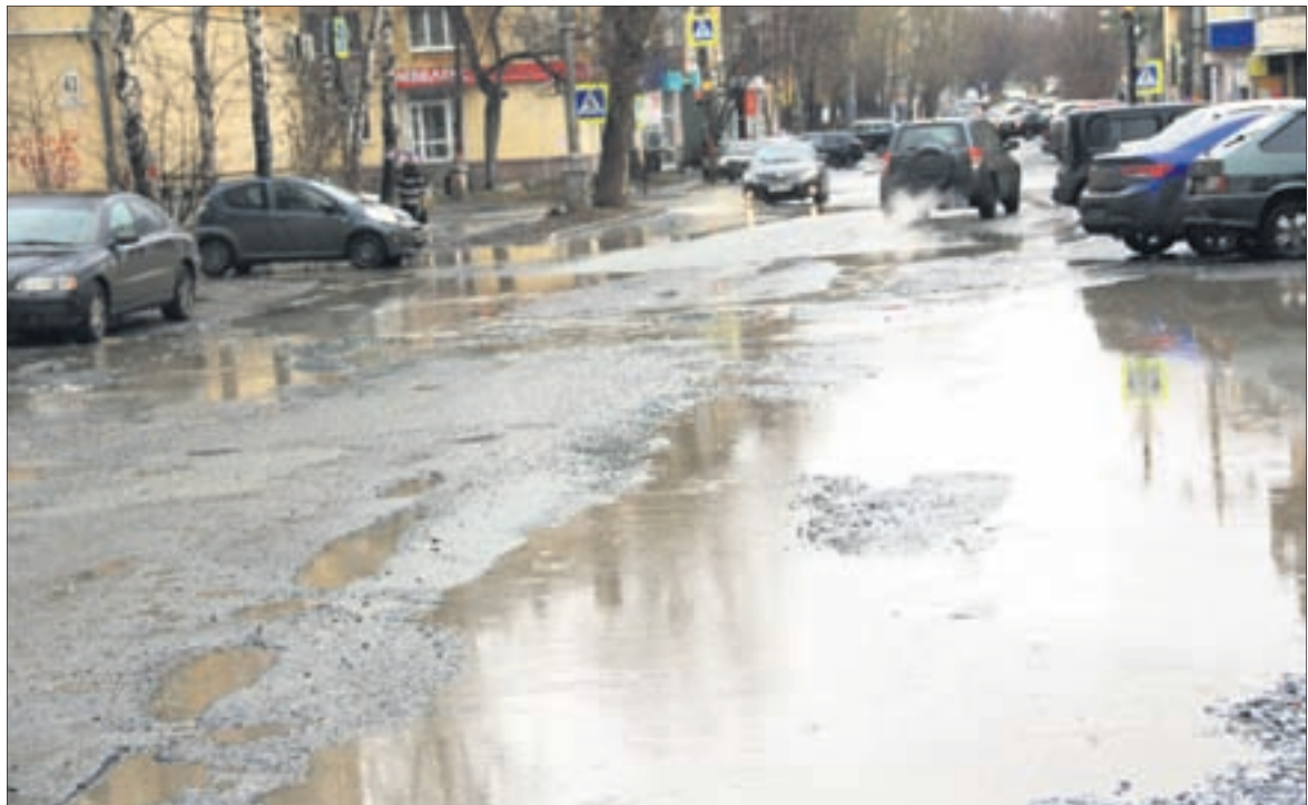
Вымостить улицу Герцена брусчаткой — идея, к которой возвращались не раз. Однако пешеходного центра в Первоуральске пока нет ни в каком виде: хоть с брусчаткой, хоть без нее.

— Негодование жителей Самостроя понятно — за время проживания люди успели «обрасти» хозяйством, поставить заборы и даже кое-какие постройки, — комментирует Станислав Вячеславович. — Но негодование негодованием, но существует закон, который надо выполнять. Приведу простой пример. Высотка. Лифтовое отделение многоэтажного дома находится на последнем этаже. Хозяин одной из квартир перегородил лестничную клетку металлической дверью, ограничив тем самым доступ к