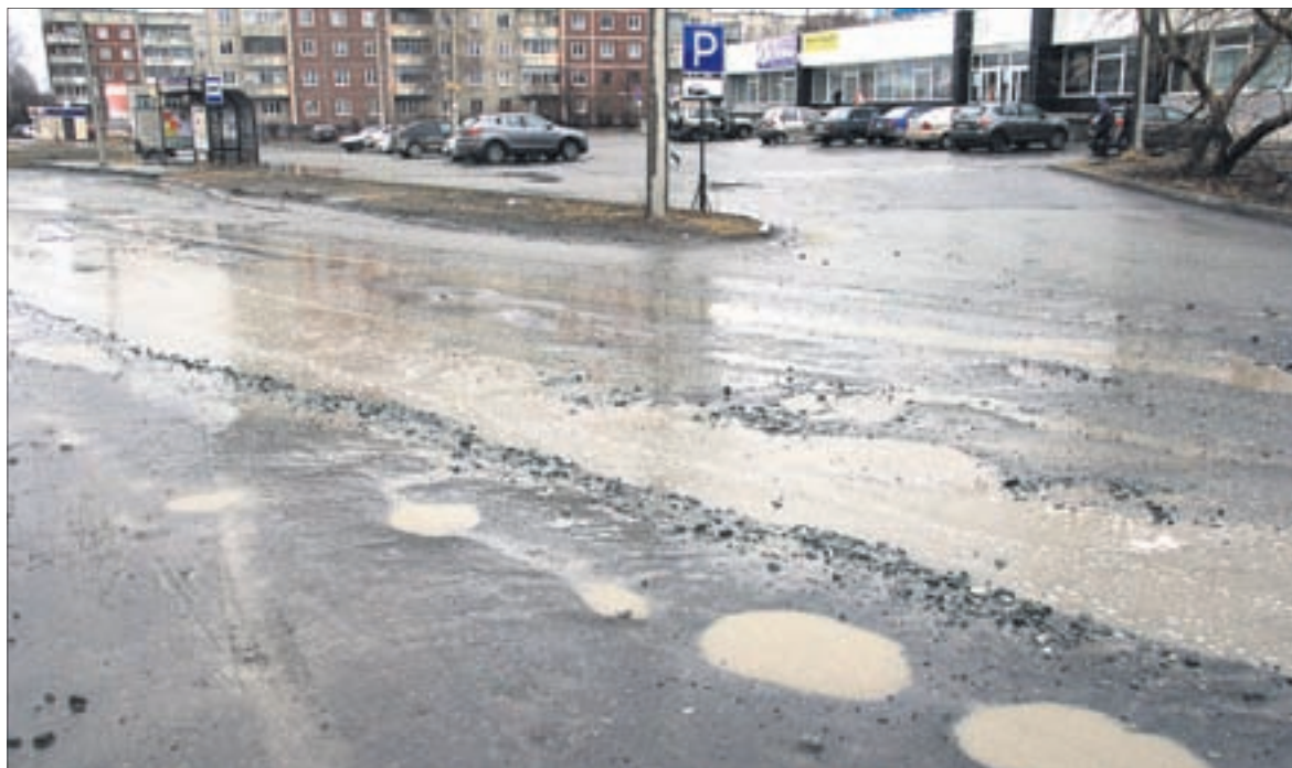
Укрепленная дорожная одежда на объездных автодорогах — необходимое условие их функционирования, учитывая, что именно там ходят большегрузы.

! В ближайшее время администрация выставит на конкурс текущие ремонты улиц: Орджоникидзе, Дружбы, Сакко и Ванцетти, текущий ремонт улицы Ленина на всем ее протяжении, участки от рынка до улицы Строителей, от улицы Строителей до Береговой, от проспекта Космонавтов через улицу Емлина. Кроме того, планируется отремонтировать участок дороги по ул. Орджоникидзе — маршрут шествия Бессмертного полка (поручение сити-менеджера, если компания «Уралдортехнологии» выиграет тендер на ремонт ул. Орджоникидзе, выполнить ремонт к 9 мая).