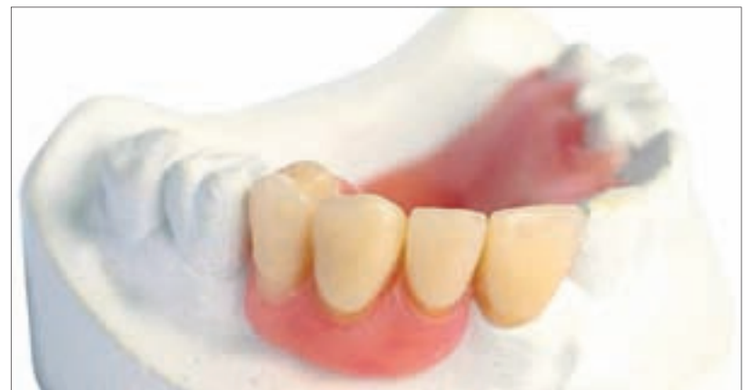
Современные зубные протезы

Считается, что современные вставные зубы придумал дантист Людовика XV Пьер Фосар, который делал протезы для самых знаменитых людей своего времени. Он же