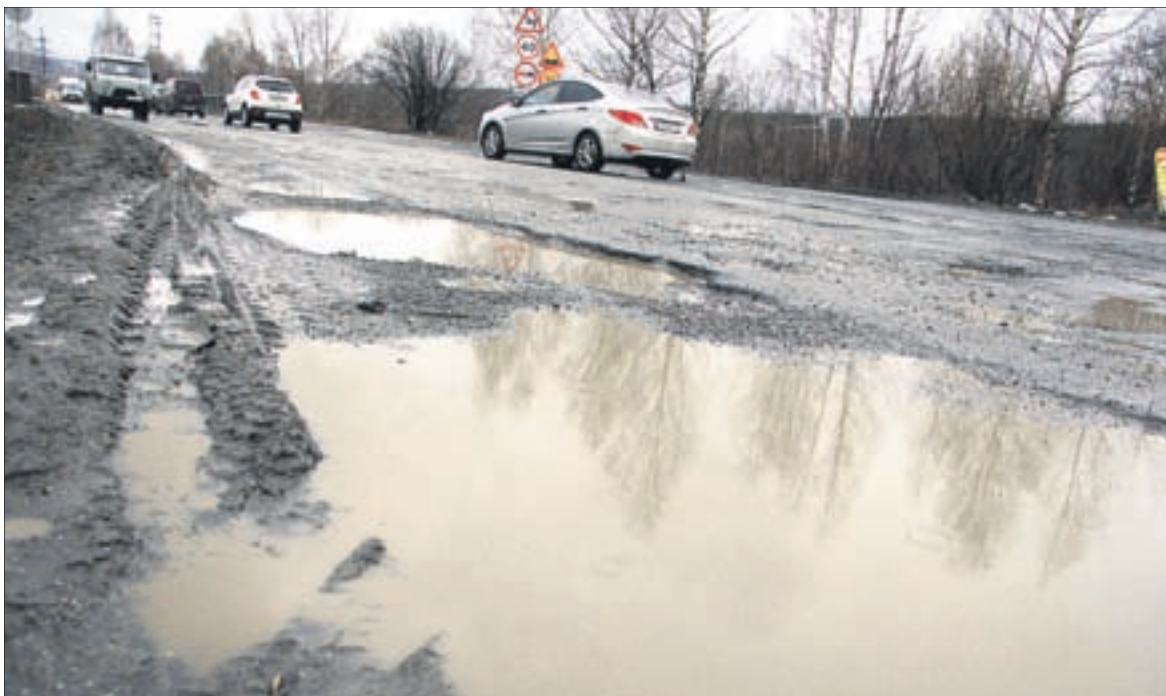
Главная боль автомобилистов — Динасовское шоссе. Участок дороги собираются отремонтировать уже этим летом, правда, без оборудования ливневки. Надеемся на появление отводных канав.

Ям много, наш фотограф мечется от одной к другой в поисках самой живописной. Подсказываем: самое живописное — мост, на