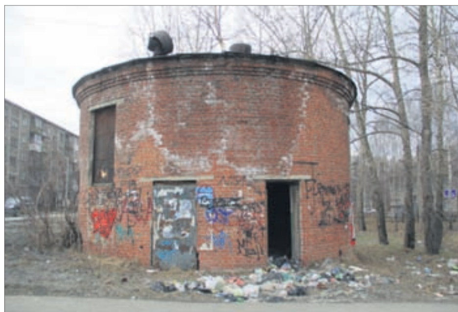
Здание на Вайнера уже настолько старое, что и пенсионеры не могут вспомнить, для чего оно было построено.

— Я обращался в управляющую компанию «Даниловское», там сказали, что земля — не их, здание им не принадлежит, поэтому сделать с ним что-то — отремонтировать или снести — они по закону не имеют права, — говорит пенсионер. — Обра-