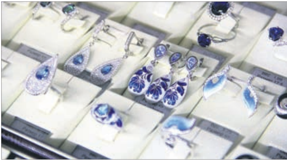
Изделия из драгоценных металлов с эмалью — модно и необычно.