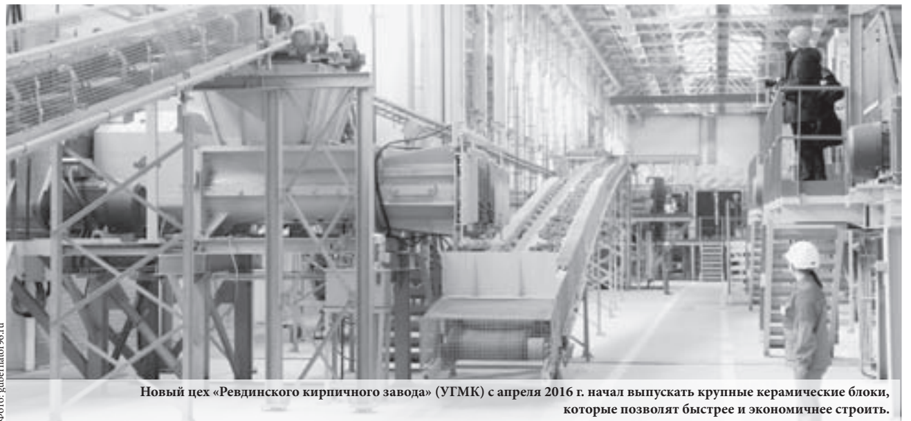
Новый цех «Ревдинского кирпичного завода» (УГМК) с апреля 2016 г. начал выпускать крупные керамические блоки, которые позволят быстрее и экономичнее строить.