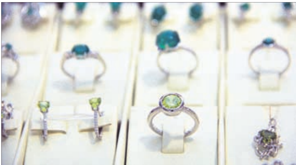
Кольца с драгоценными и полудрагоценными камнями — неподвластная моде классика.