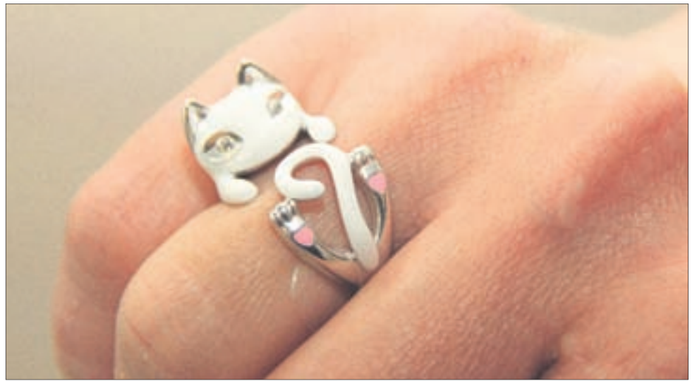
Оригинальные кольца в виде зверюшек — для молодых и модных.